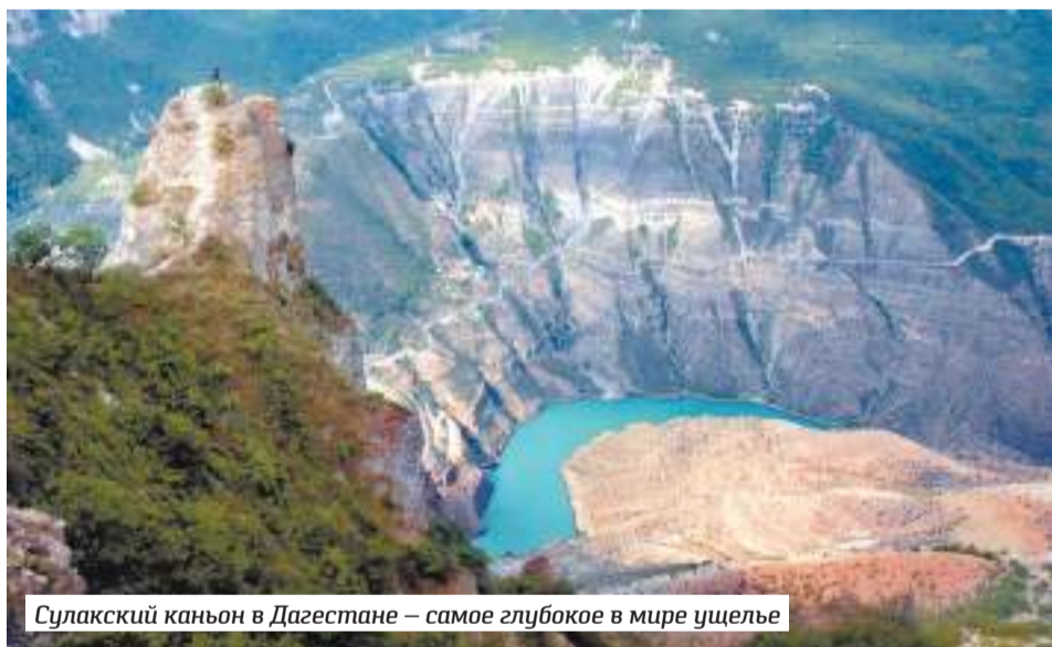
Сулакский каньон в Дагестане — самое глубокое в мире ущелье

От Волгограда до Махачкалы — 850 км, по пути можно заехать в Элисту, столицу Калмыкии. Здесь интересно посмотреть на крупный буддистский хурул «Золотая обитель Будды Шакьямуни», пообедать национальными калмыцкими блюдами и попробовать питательный джомбу — чай с молоком, сливочным маслом, солью и