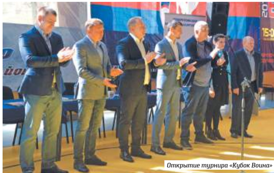
Открытие турнира «Кубок Воина»

В то время саньда был популярным, зрелищным и оплачиваемым видом спорта.