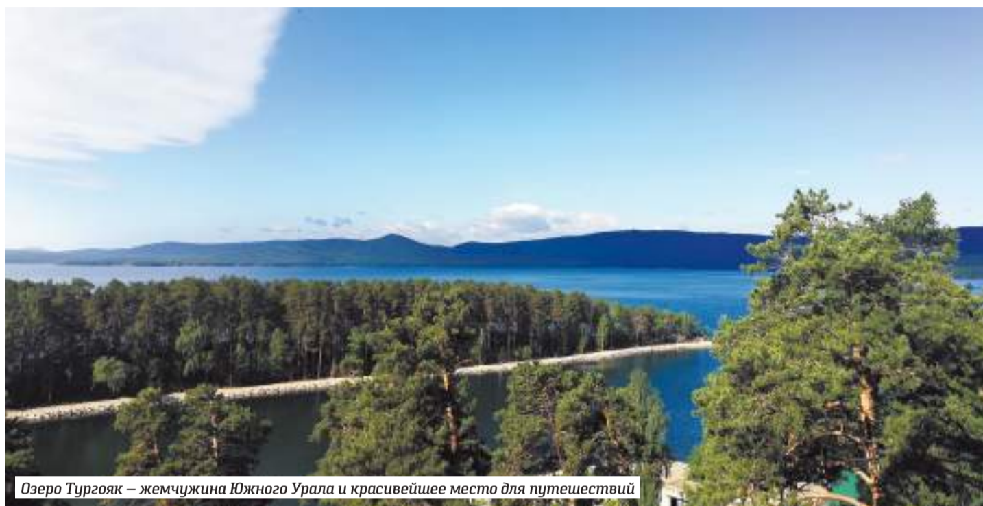
Озеро Тургойак – жемчужина Южного Урала и красивейшее место для путешествий