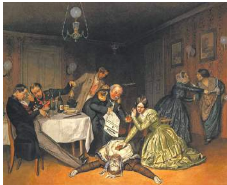
П. Федотов, «Всё холера виновата», 1848 год