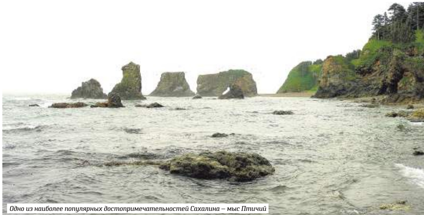
Одно из наиболее популярных достопримечательностей Сахалина — мыс Птичий