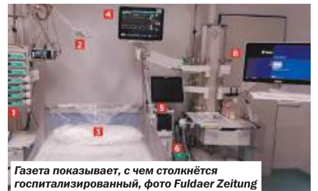
Газета показывает, с чем столкнётся госпитализированный

будущем, но работники загса, понимая это, предложили сыграть свадьбу экспромтом — прямо сейчас, не дожидаясь, когда на страну опустится комендантский час. В последнюю пятницу перед карантином двое наследников приехали в зал и без лишних свидетелей сказали заветное «да». Жених, который узнал о такой возможности от невесты, буквально выскочил из домашнего офиса. Костюм, едва пошитый, забирали от портного по дороге в зал, дату на кольцах выгравировали с ошибкой. Не было и праздничного ужина: событие отметили вечером в саду вместе с родителями за пиццей прямо из картонных коробок.