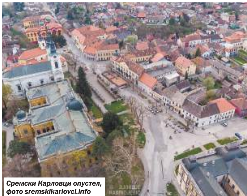
Сремски Карловци опустел

Издание Sremski Karlovci Info пишет о решении муниципалитета помочь пожилым людям с низкими доходами: для них покупают продукты и дезинфицирующие вещества. Низким в сообщении назван доход в 30 000 сербских динаров, что примерно равняется 20 тысячам российских рублей, при этом обычный серб в среднем в переводе на рубль получает около 42 тысяч «чистыми» ежемесячно.