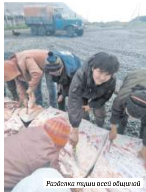
Разделка туши всей общиной