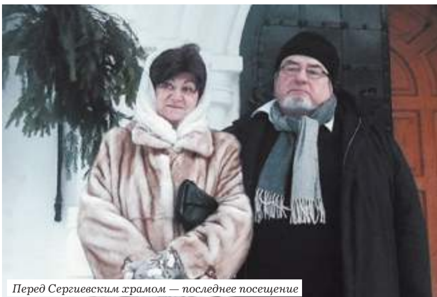
Перед Сергиевским храмом — последнее посещение