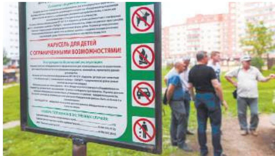
Фото из архива редакции, 2018 год

Установить карусель в «Скитских прудах» обещают в ближайшее время. Главное, чтобы все посетители парка помнили, что она — особенная: кататься на ней смогут все, но исключительно внутри и сидя. «Для двух аналогичных конструкций сейчас также подыскивается место. Есть вероятность, что их установят в парке «Покровский», что в Хотькове, а также у здания центра «Время надежды» на Валовой улице в Сергиевом Посаде», — пояснили в администрации.