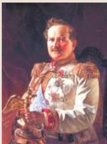
Князь В. А. Долгоруков, 1882 г.