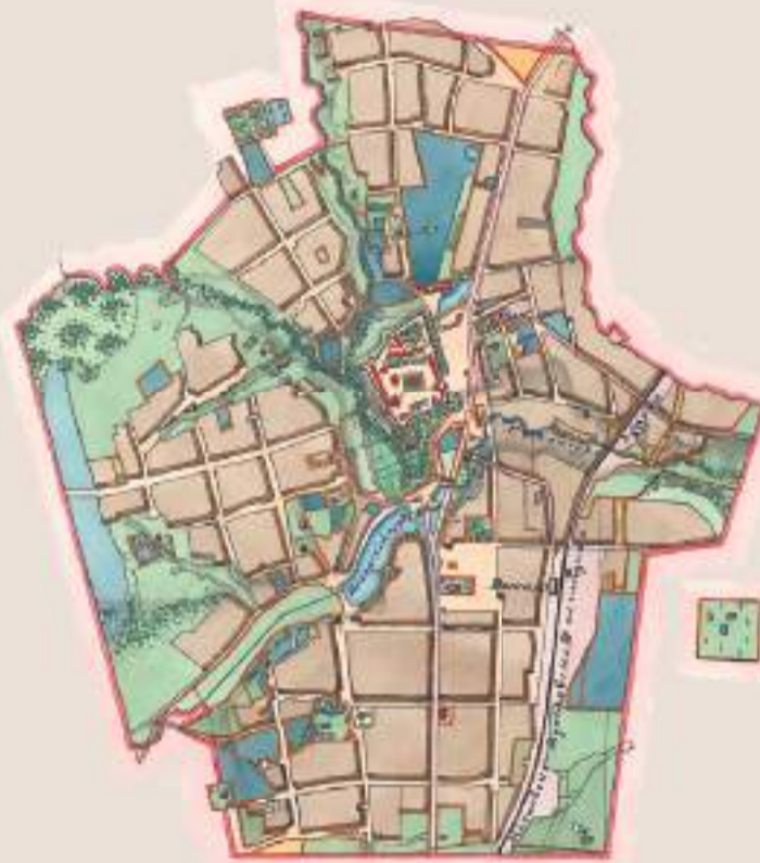
В XIX веке Посад рос, развивался и справедливо претендовал на роль уездного города

Совсем иное дело видим в 1880 году, когда дума Сергиевского посада от имени граждан постановила ходатайствовать перед Московским генерал-губернатором князем В. А. Долгоруковым об отделении от Дмитрова в административном отношении с тем, чтобы часть Дмитровского уезда включить в новый Сергиевский уезд, или же сделать Посад безуездным городом с подчинением