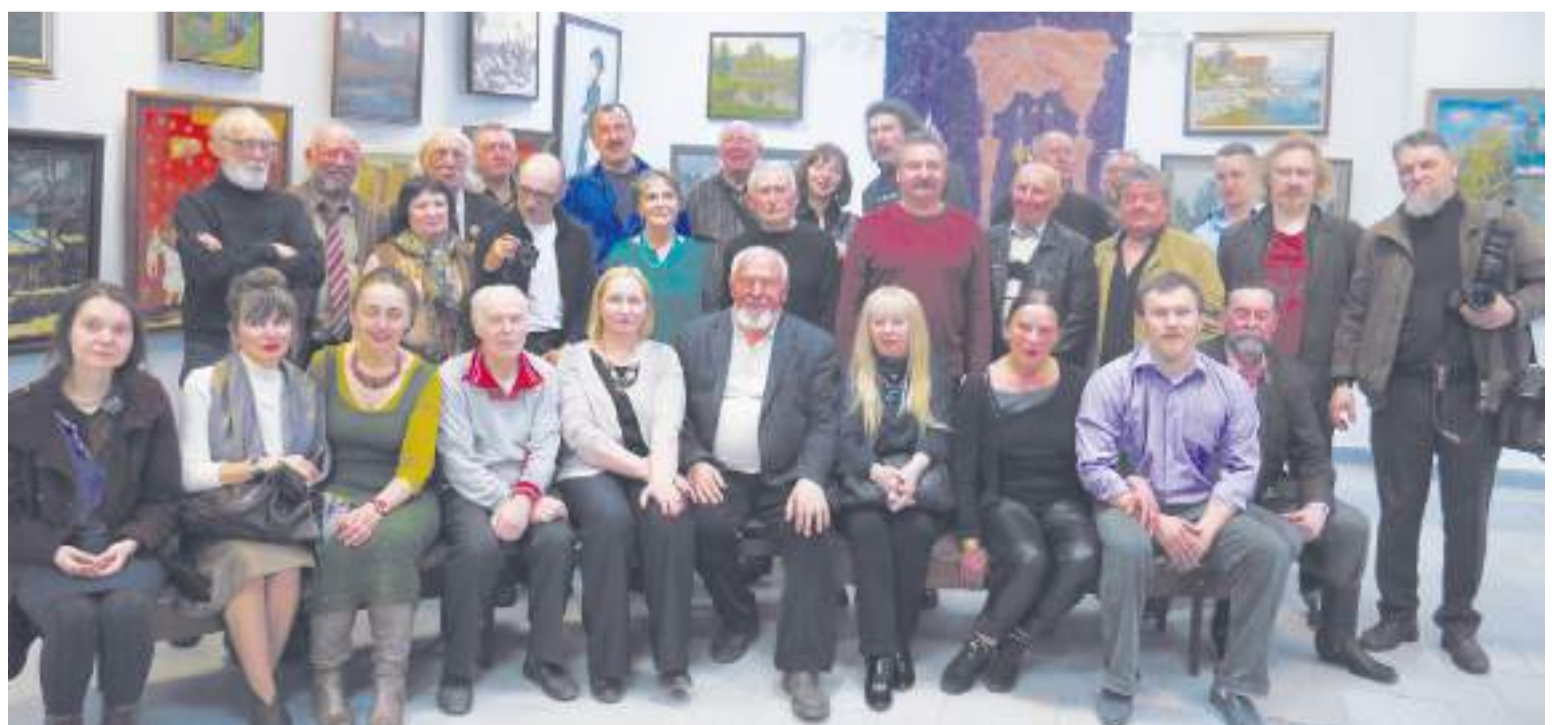
Только часть большой семьи посадских художников