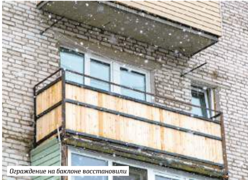
Ограждение на балконе восстановили