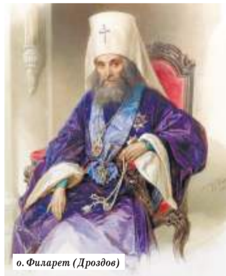
о. Филарет (Дроздов)

Отметим сразу: в нашем материале речь пойдёт о переписке, касающейся строительной деятельности на территории обители, других вопросов мы касаться не будем.