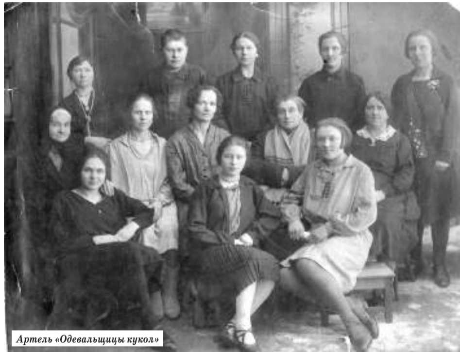
Артель «Одевальщицы кукол»

Артель находилась под непосредственным надзором местной полиции, платила государственный промысловый налог. Правление в составе двух человек избиралось на один год, в его обязанности входили приёмка заказов и их распределение, закупка необходимых материалов и орудий производства, управление недвижимостью для осуществления работы. Финансы складывались из основного, запасного и вспомогательного капиталов, состоящих из паевых взносов участников сообщества и прибыли