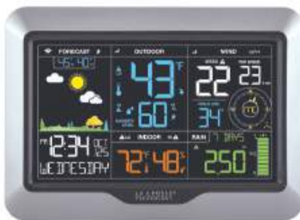
Данные с метеостанции сходятся примерно на такой экран

Сергиевопосадскую погоду можно отслеживать на сайте станции Игоря narodmon.ru/787