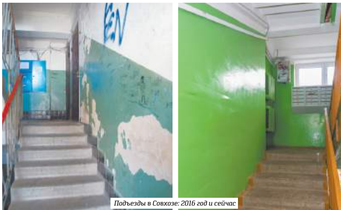
Подъезды в Совхозе: 2016 год и сейчас

Сегодня почти всё население Вакцины — гражданские: бывшие военнослужащие и работники части, их дети, оставшиеся в квартирах после смерти родителей и не воспользовавшиеся жилищными сертификатами. На территории городка нет ни одного собственника квартиры, всё жильё принадлежит Министерству обороны РФ. Жилплощадь здесь нельзя ни купить, ни продать — правда, говорят, сделки всё же случаются путём заключения фиктивных браков. То и дело идут разговоры, что Минобороны избавится от всех гражданских, выселив их на «большую землю». Но пока реальных предпосылок к этому нет: пустующих комнат на территории городка для вновь прибывающих офицеров вполне достаточно