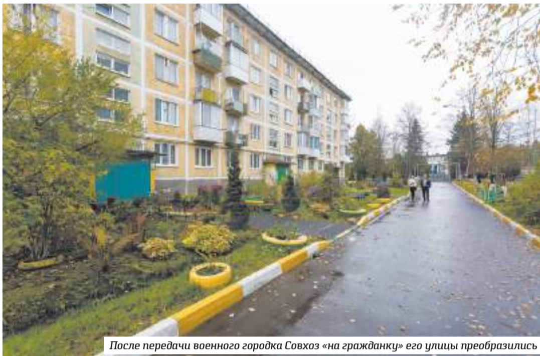
После передачи военного городка Совхоз «на гражданку» его улицы преобразились

Жители уверены, что решить бесчисленные коммунальные проблемы посёлка сможет передача коммунальной инфраструктуры от Министерства обороны в округ. Совсем недавно это было сделано