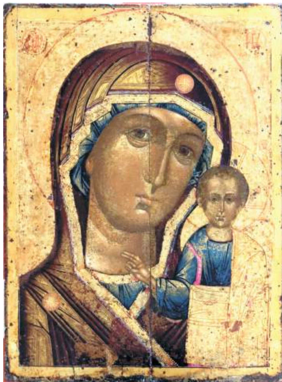
Икона Свято-Троицкого собора — один из древних списков с чудотворного первообраза. Этот образ был написан в XVIII веке. Впоследствии икону неоднократно переписывали. Первоначальный образ скрывали несколько слоёв поздней записи. В 2005 году икона была отреставрирована.

При обыске на квартире Чайкина были обнаружены драгоценности и частицы украшений с икон Богородицы и Спасите-