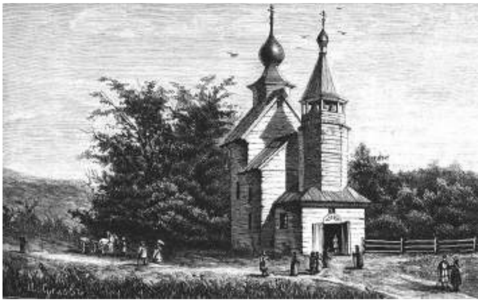
Сергиевская церковь, рисунок из журнала «Нива», 1850 г.