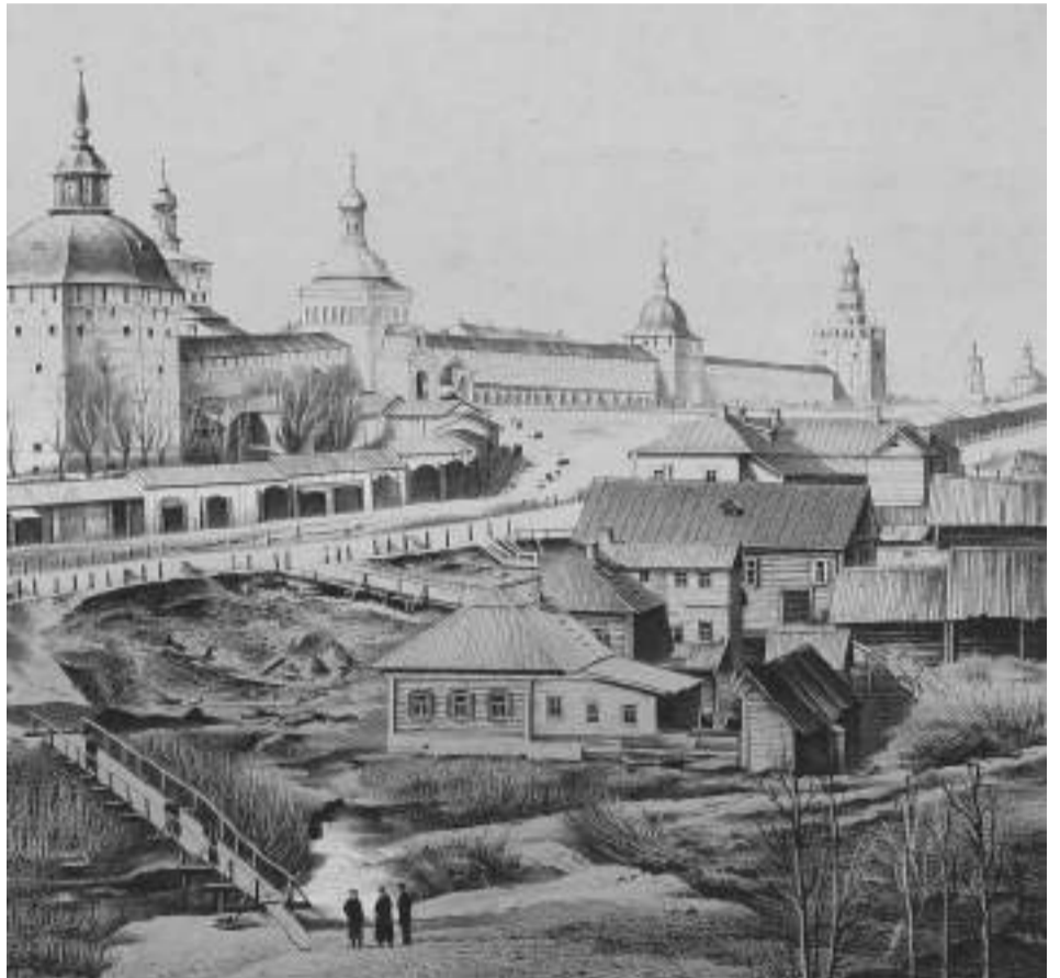
Дома служителей подольных церквей на новом месте. Фрагмент литографии 1860-х гг.