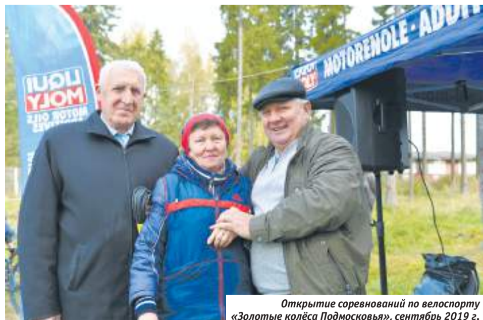
Открытие соревнований по велоспорту «Золотые колёса Подмосковья», сентябрь 2019 г.