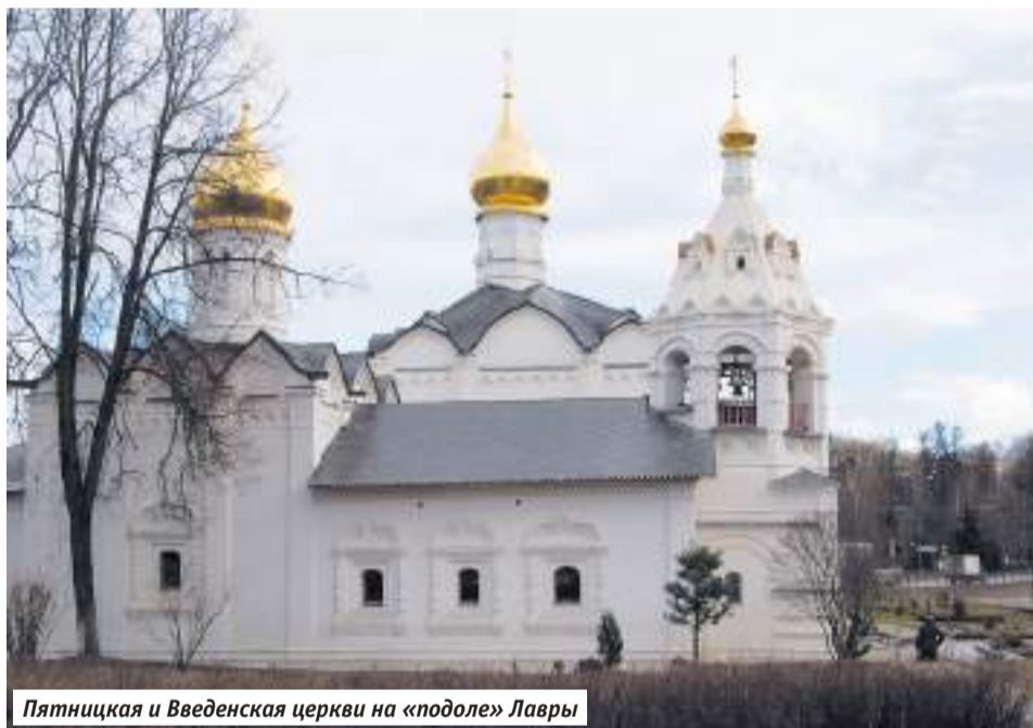
Пятницкая и Введенская церкви на «подоле» Лавры

Как и всякое большое дело, перепланировка Сергиевского посада проходила не без трудностей. Так, немалое упорство в нежелании покидать свои дворовые места проявили священник, дьячок и пономарь — служители Пятницкой и Введенской церквей на Подоле, что близ Пятницкой башни Троице-Сергиевой лавры.