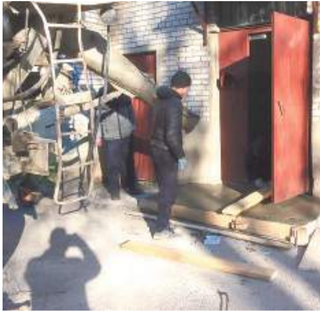
Бывшее общежитие на улице Михеенко в Хотькове будет отремонтировано.