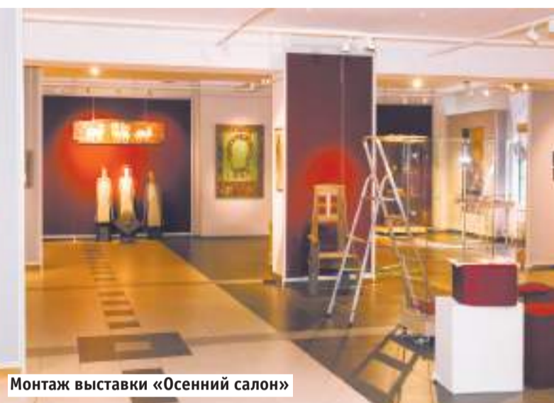
Монтаж выставки «Осенний салон»

За кадром каждого «Салона» остаётся большой долгий труд десятков человек, от охранников до искусствоведов. Мы попросили Светлану ГОРОЖАНИНУ, заведующую отделом русского народного и декоративно-прикладного искусства XVIII–XXI веков, побыть нашим проводником на грандиозной выставке, которая вот-вот откроется.