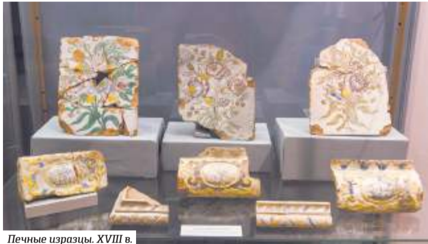
Печные изразцы. XVIII в.