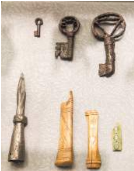
Ключи, сулица — железо, ковка. Рукоятки ножей — кость, резьба, гравировка, инкрустация