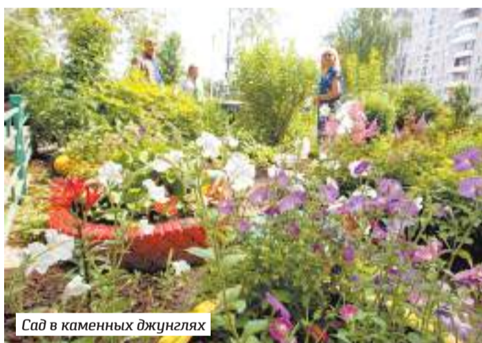
Сад в каменных джунглях