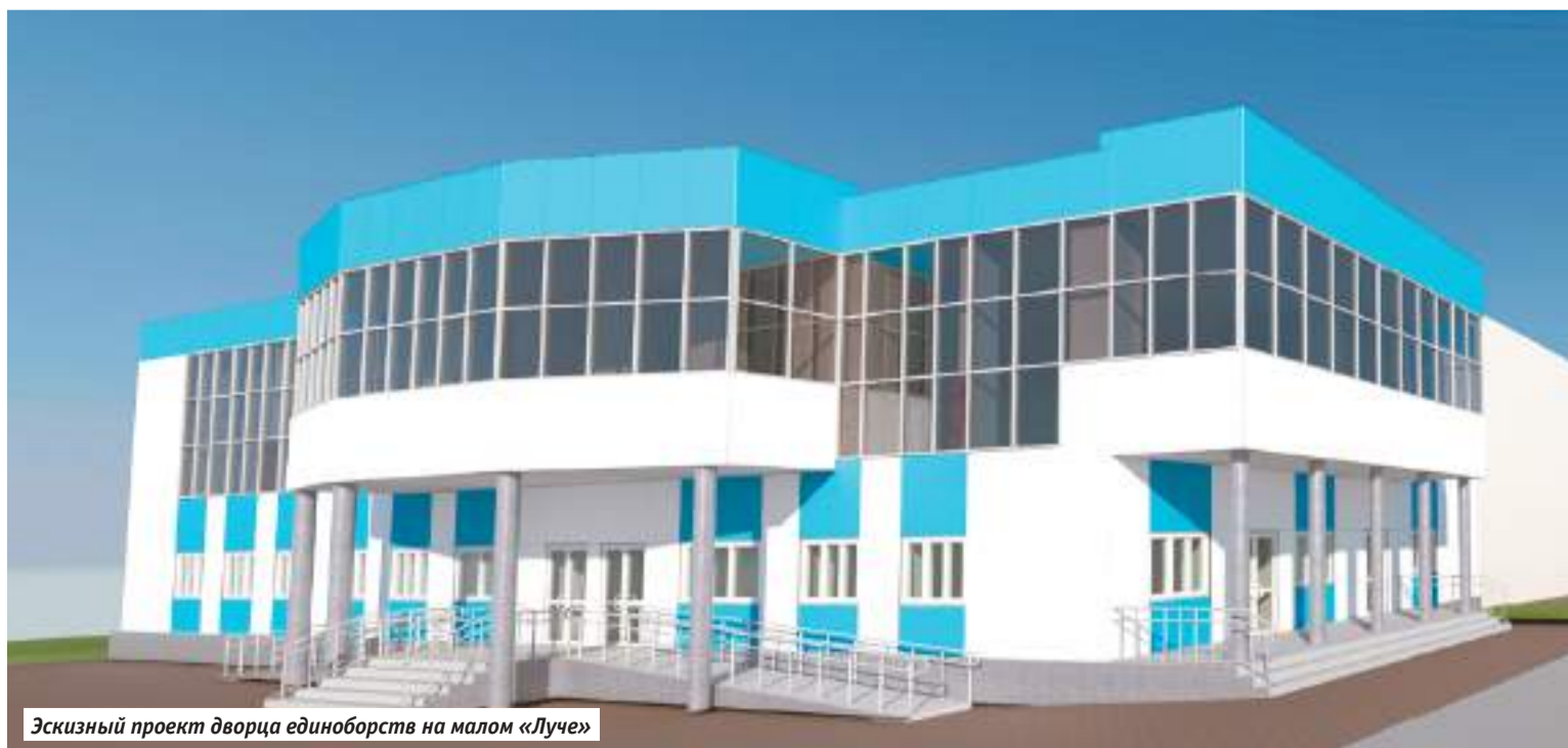
Эскизный проект дворца единоборств на малом «Луче»