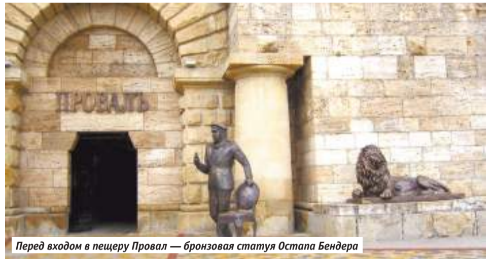
Перед входом в пещеру Провал — бронзовая статуя Остаса Бендера

В Кисловодске найти галерею с минеральной водой сложнее. В Железноводске бюветов достаточно, и все они сосредоточены