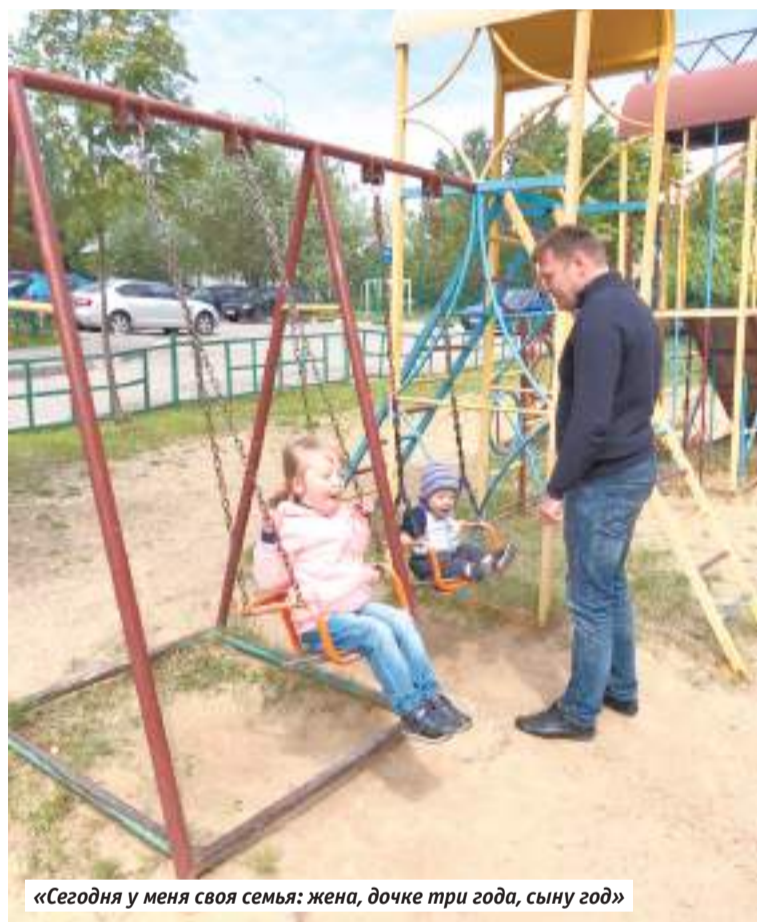
«Сегодня у меня своя семья: жена, дочке три года, сыну год»

теперь семнадцать не построишь. Установлены предельные отступы от границ и заборов, высота, этажность, материалы стен, протяжённость линий по фасадам. Это нужно для того, чтобы у города сохранился исторический облик. Принимая документ, мы внесли в него много правок и необходимых уточнений. Сейчас будет продолжаться работа над генпланом и правилами застройки городского округа.