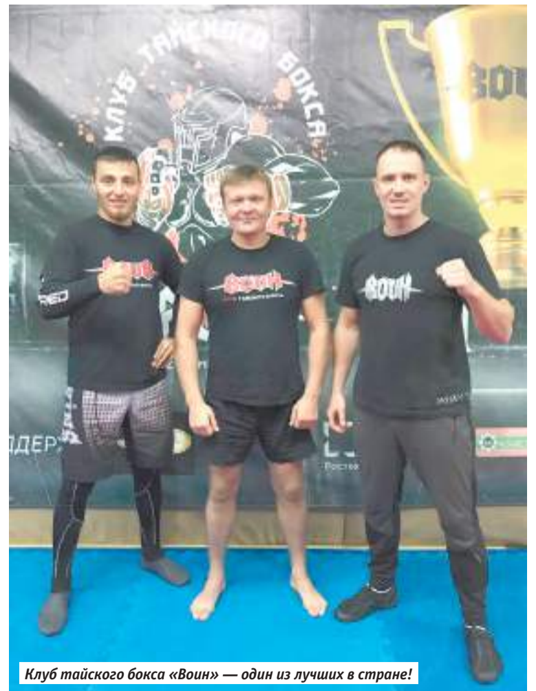
Клуб тайского бокса «Воин» — один из лучших в стране!

— Утверждение Генплана Сергиева Посада. Это позволило установить границы охранных зон вокруг Троице-Сергиевой лавры. Для бизнеса это чёткие правила строительства, которые позволяют избежать коррупционной составляющей. Если положено два этажа,