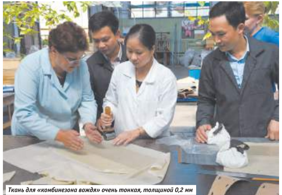
Ткань для «комбинезона вождя» очень тонкая, толщиной 0,2 мм

— Он удерживает бальзамические мази и растворы, позволяет им как можно дольше сохранять свои свойства. «Комбинезон»