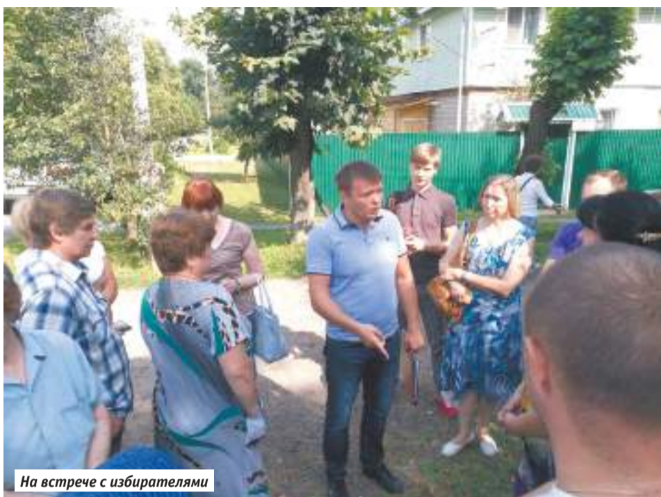
На встрече с избирателями