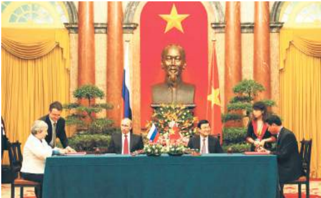
На встрече с президентом России Владимиром Путиным и президентом Вьетнама Чыонг Танг Шангом