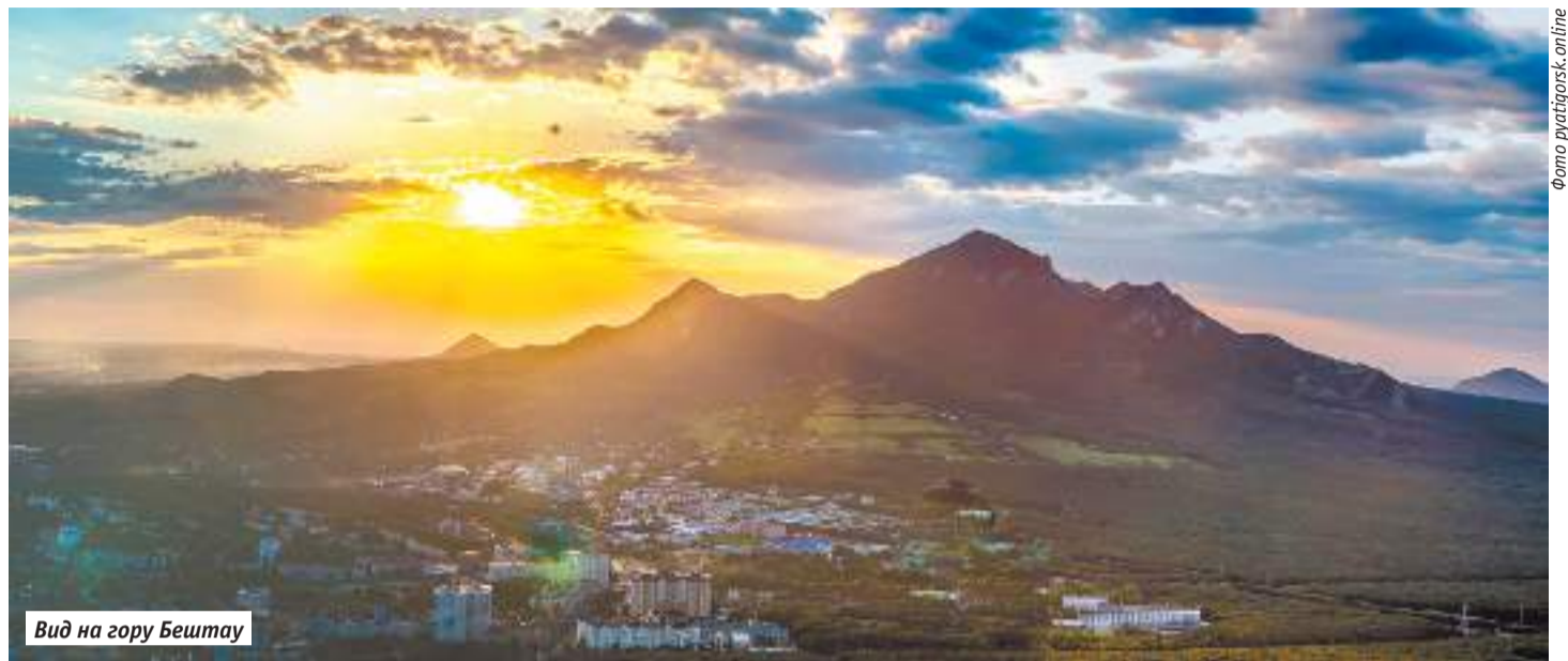
Вид на гору Бештау

На многие горы можно подняться: на Машук из Пятигорска, на Бештау и Железную из Железноводска. На Машук и Железную ведут асфальтовые тропки. На Бештау маршрут более дикий, но пятиглавый красавец того стоит. Здесь пьянящие цветочные поляны и завораживающие виды. Тропка