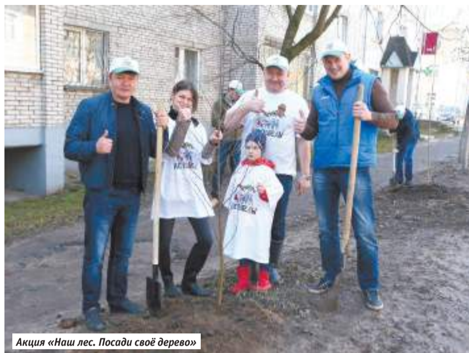
Акция «Наш лес. Посади своё дерево»