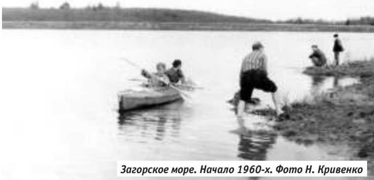
Загорское море. Начало 1960-х.