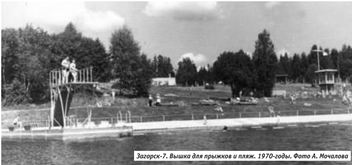
Загорск-7. Вышка для прыжков и пляж. 1970-годы.