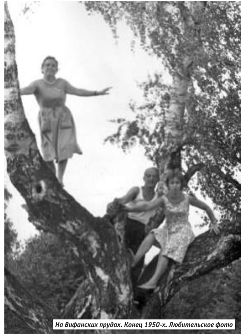
На Вифанских прудах. Конец 1950-х.

До конца 60-х активно купались у пруда вблизи микрорайона Ферма, имевшего бытовое название «Катеринка». Молва связывала его с именем Екатерины II, будто у государыни тут была купальня, отделанная мрамором. И что одна мраморная плита лежит на дне. А если парень случайно встанет на неё обеими ногами, то все девушки — его, а если девчонка, то немало сердец она разобьёт!