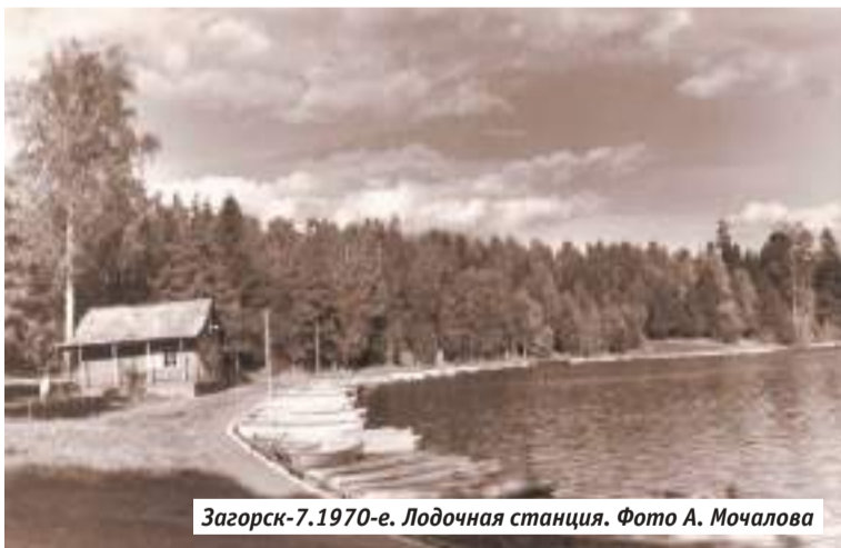
Загорск-7. 1970-е. Лодочная станция.