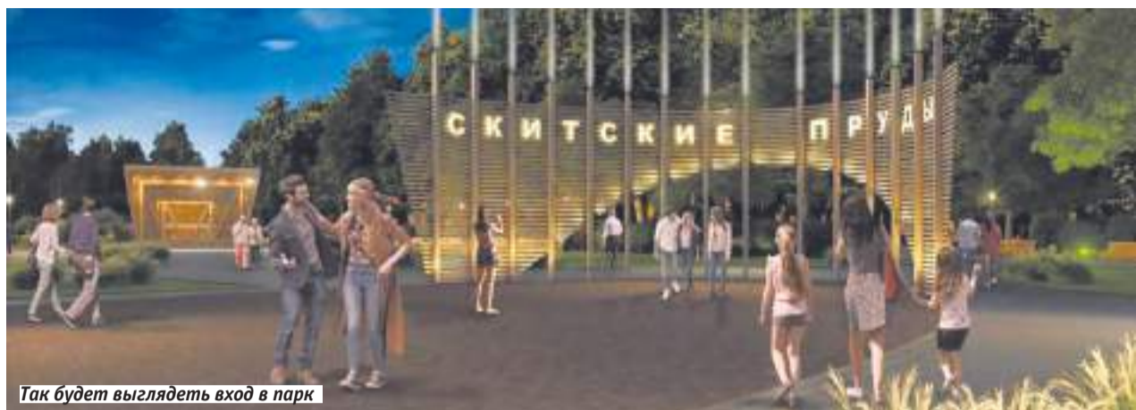
Так будет выглядеть вход в парк