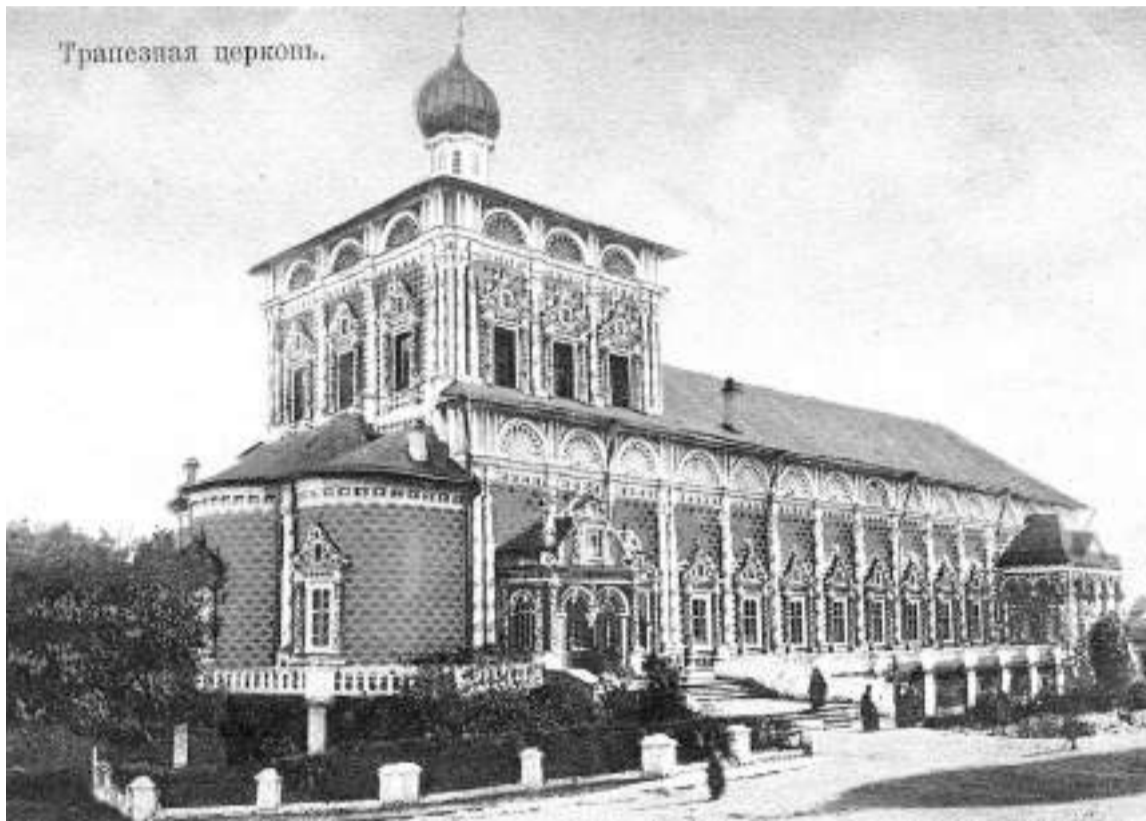
Трапезная палата с Сергиевской церковью

Многочисленные рабочие руки и богатая казна позволили совместить восстановление повреждённых огнём монастырских