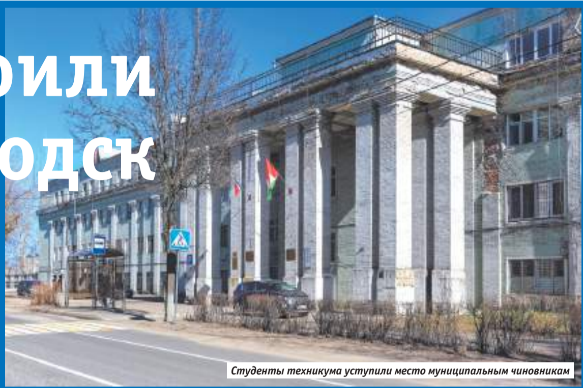
Студенты техникума уступили место муниципальным чиновникам

23 АПРЕЛЯ 1919 ГОДА — РОВНО 100 ЛЕТ НАЗАД — В ТРОИЦКОМ СНАРЯЖАТЕЛЬНОМ ЗАВОДЕ, БУДУЩЕМ КРАСНОЗАВОДСКОМ ХИМИЧЕСКОМ — ПОЯВИЛСЯ ОТДЕЛ ГЛАВНОГО АРХИТЕКТОРА. ЕСЛИ НЕ ЗНАТЬ ИСТОРИЮ СОВЕТСКОГО ГРАДОСТРОИТЕЛЬСТВА — СОБЫТИЕ ЗАУРЯДНОЕ. СКОЛЬКО ИХ, ПРЕДПРИЯТИЙ, В ЭПОХУ ИНДУСТРИАЛИЗАЦИИ ПОНАОТКРЫВАЛИ? НО КАК «ПОЭТ В РОССИИ БОЛЬШЕ ЧЕМ ПОЭТ», ЗАВОД В СССР — БОЛЬШЕ, ЧЕМ ЗАВОД. ЗА КАЖДЫМ ПРЕДПРИЯТИЕМ ПЛАНОВАЯ ЭКОНОМИКА ЗАКРЕПЛЯЛА МИССИЮ ПО СОЗДАНИЮ КОМФОРТНЫХ БЫТОВЫХ УСЛОВИЙ ДЛЯ КЛАССА-ГЕГЕМОНА, ЧТОБЫ ТОТ ОХОТНЕЕ ПЕРЕЕЗЖАЛ ИЗ СЕЛА В ГОРОД.