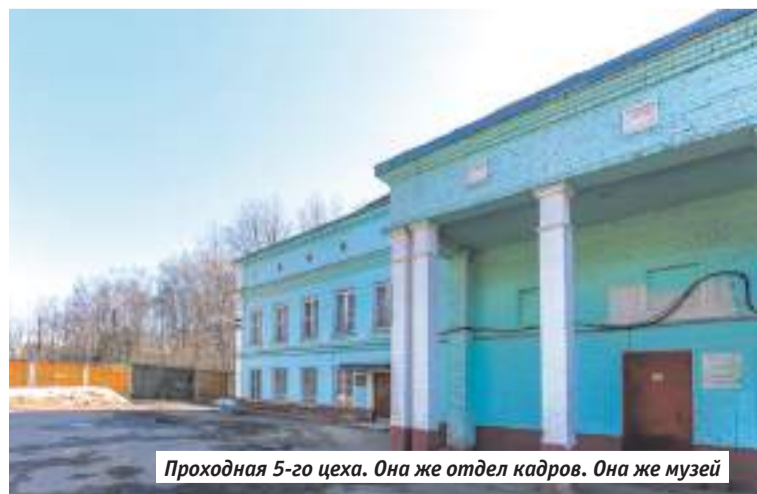
Проходная 5-го цеха. Она же отдел кадров. Она же музей