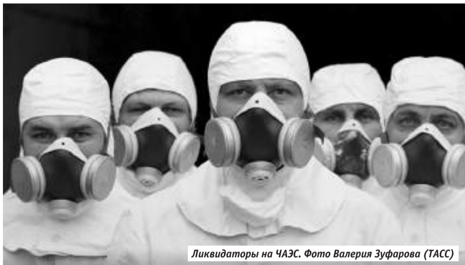
Ликвидаторы на ЧАЭС.