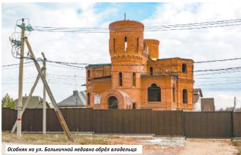
Особняк на ул. Больничной недавно обрёл владельца