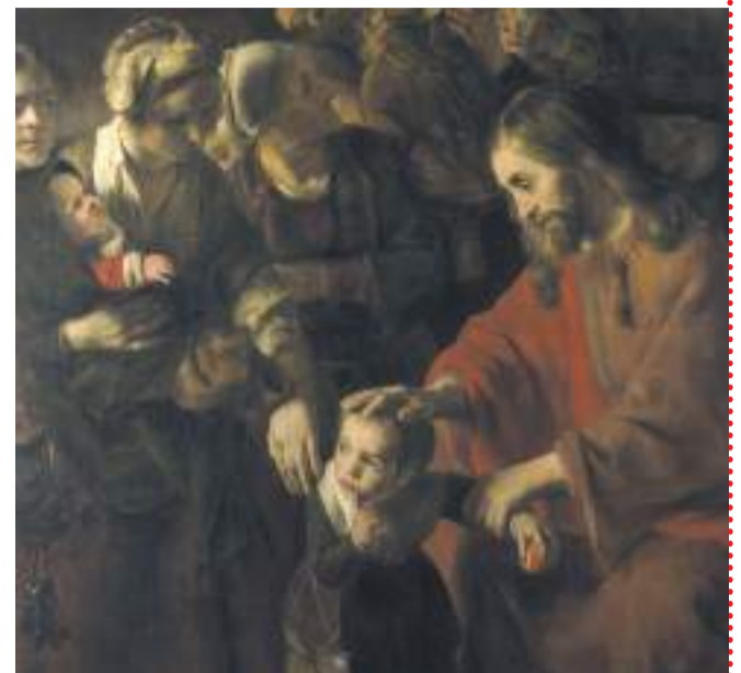
Христос благословляет детей. Николас Мас, 1652-1653

Вы должны научить его самой краткой и понятной ему молитве: «Господи, помилуй!» Вам необходимо объяснить сыну, что как только его посещают подобные мысли, то вместе с ними за