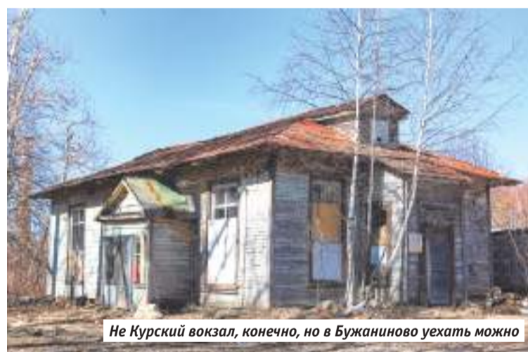
Не Курский вокзал, конечно, но в Бужаниново уехать можно

ные средства заводчан. В клубе занимались политграмотой, самодеятельностью. Зал на 250 мест принимал столичные театральные труппы. Впоследствии здание превратили в пионерлагерь. В 1982 году его уничтожил пожар. Макет сохранился в заводском музее. Современный Краснозаводск такое здание наверняка бы украсило.