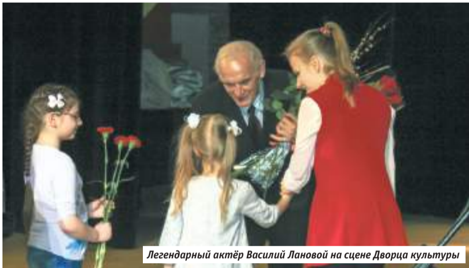
Легендарный актёр Василий Лановой на сцене Дворца культуры

Неважно, сколько тебе лет и сколько денег у тебя в кармане на сегодняшний момент: если ты живёшь в России, у тебя за душой есть нечто, не поддающееся материальной оценке — менталитет победителя, чувство гордости за страну, которая смогла, выстояла.