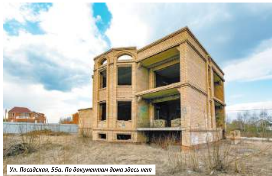
Ул. Посадская, 55а. По документам дома здесь нет