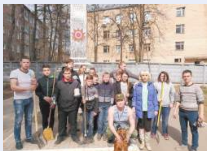
Коммунисты Сергиева Посада исполняли ленинские заветы на Рабочем посёлке, убирая территорию вокруг памятника воинам — работникам завода № 6 на Аллее Славы. В акции приняли участие райком КПРФ и бужаниновские школьники.