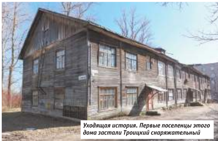
Уходящая история. Первые поселенцы этого дома застали Троицкий снаряжательный