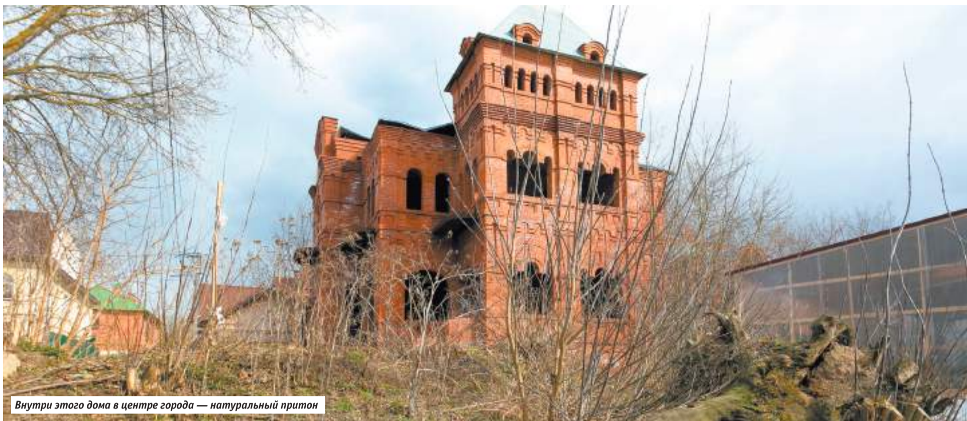
Внутри этого дома в центре города — натуральный притон