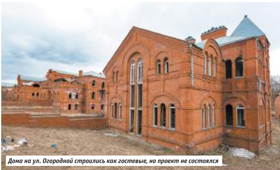
Дома на ул. Огородной строились как гостевые, но проект не состоялся