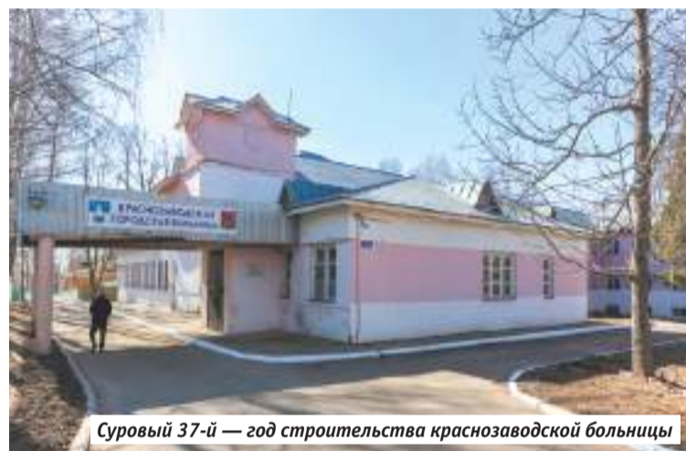
Суровый 37-й — год строительства краснозаводской больницы

Рабочий клуб 1923 года, который строители гордо называли Дворцом и даже театром! До возведения ДК «Радуга» был главным культурным очагом этих мест. Возводился на волонтерских началах по выходным на собствен-