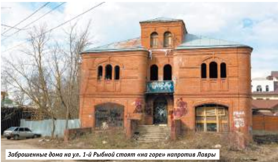
Заброшенные дома на ул. 1-й Рыбной стоят «на горе» напротив Лавры