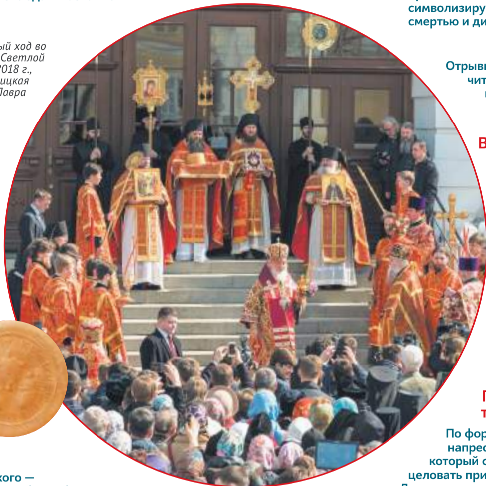
► Крестный ход во вторник Светлой Седмицы 2018 г., Свято-Троицкая Сергиева Лавра

По форме напоминает напрестольный крест, который священник дает целовать прихожанам после Литургии, но вместо Распятия на нем изображено Воскресение Христово. К самому кресту крепятся три подсвечника. Часто трехсвечник украшают разноцветными лентами или цветами.