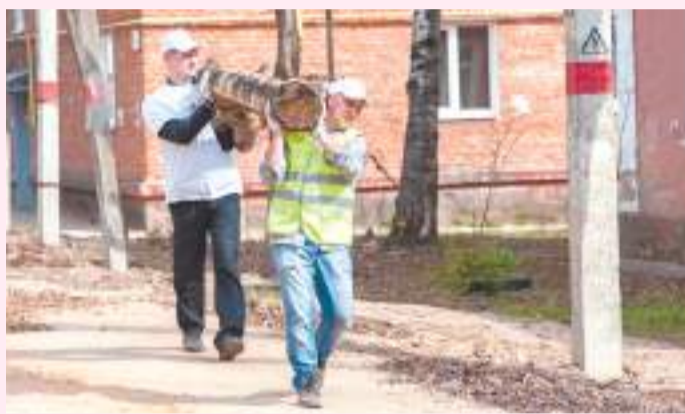
С энтузиазмом у нас на районе неплохо! Общероссийскую инициативу поддержали 37 500 человек, или каждый шестой житель.

Столетие традиции организованного волонтерского труда 20 апреля отмечали миллионы россиян. Одни вышли во дворы по зову сердца, других настойчиво попросили коллеги — и те не смогли отказать, третьи проигнорировали ритуал, считая его морально устаревшим пережитком.