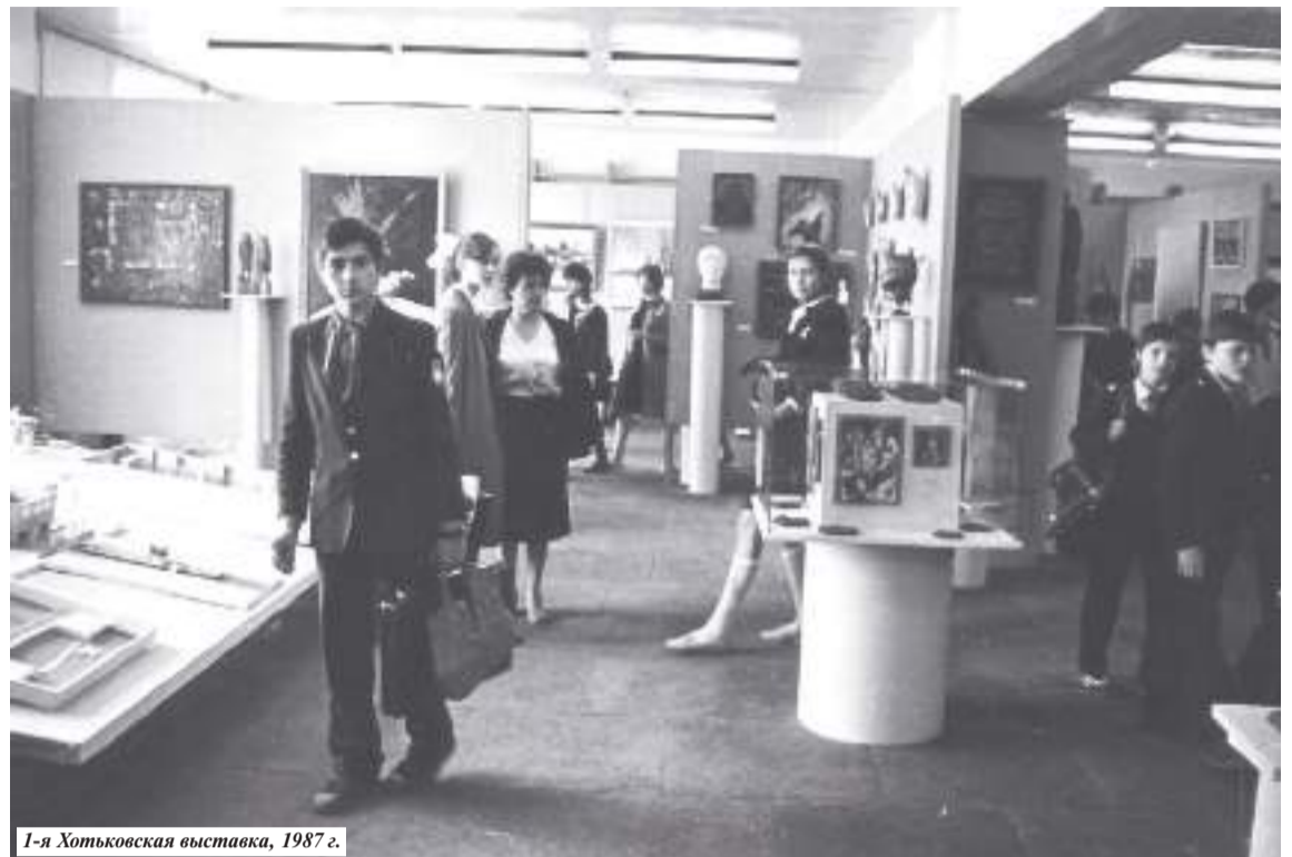
1-я Хотьковская выставка, 1987 г.