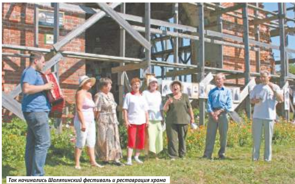
Так начинались Шляпинский фестиваль и реставрация храма