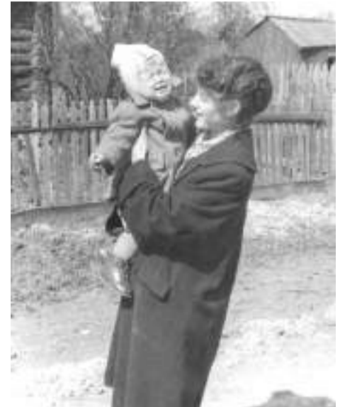
Тоня с дочкой