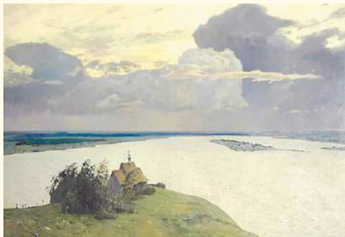
Исаак Левитан. «Над вечным покоем»

А теперь следующий вопрос конкурса. «Золотая осень», «Лето», «Берёзовая роща» — с этими полотнами ассоциируется творчество Исаака Левитана у массового зрителя. Но сам автор считал, что самое удачное его произведение — раскрывающее его мировоззрение и мироощущение —