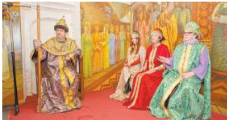
В музее вам предложат поучаствовать в ритуале выбора царской невесты

Иван IV Васильевич — кроме особенностей своей натуры, вписавшей его в историю с именем Грозный, — запомнился тем, что укрепил государственную власть, провёл судебные, церковные и военные реформы, значительно рас-