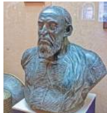
Царь Иван IV Грозный

можно рассмотреть феномен жестокости, тирании и экспансии, свойственного едва ли не всем правителям той эпохи, — фундамента, на котором вершилась дальнейшая жизнь с её достижениями и разочарованиями. А случайно ли вся сувенирная продукция музея окрашена в фирменный багровый цвет, решать посетителям.