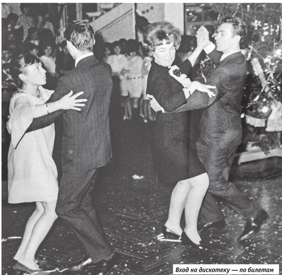
Вход на дискотеку — по билетам

деятельность тех лет была совсем не той, что мы видим сегодня. Сейчас основную аудиторию Домов или Дворцов культуры составляют дети, а в 1970-80-х — взрослые, которые после работы приходили заниматься в ДК — петь, танцевать, не только развлекаться, но и узнавать что-то новое.