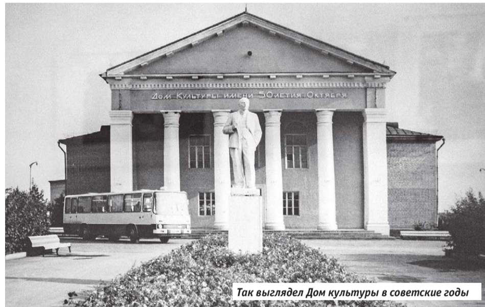
Так выглядел Дом культуры в советские годы