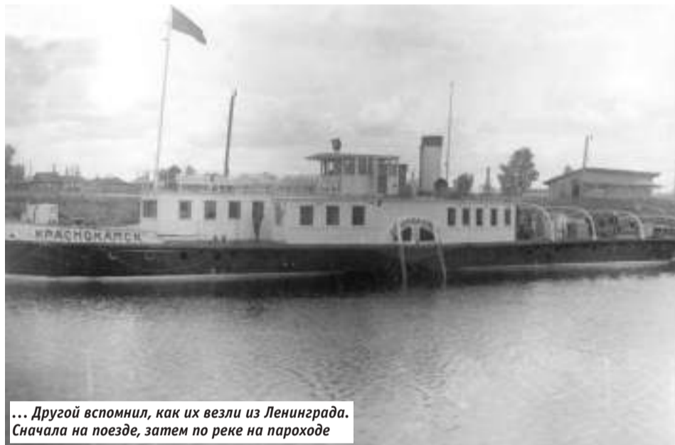
... Другой вспомнил, как их везли из Ленинграда. Сначала на поезде, затем по реке на пароходе

ской области. Мою мать, как старшую из детей, отобрали и отправили в детский дом в город Кудымкар, ныне Сыктывкар. В 1939 году деда повторно арестовали за антисоветскую деятельность и через месяц расстреляли.