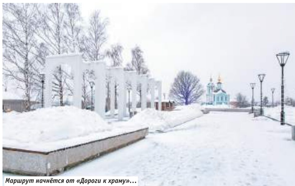
Маршрут начнётся от «Дороги к храму»...

Оксана Первозникова