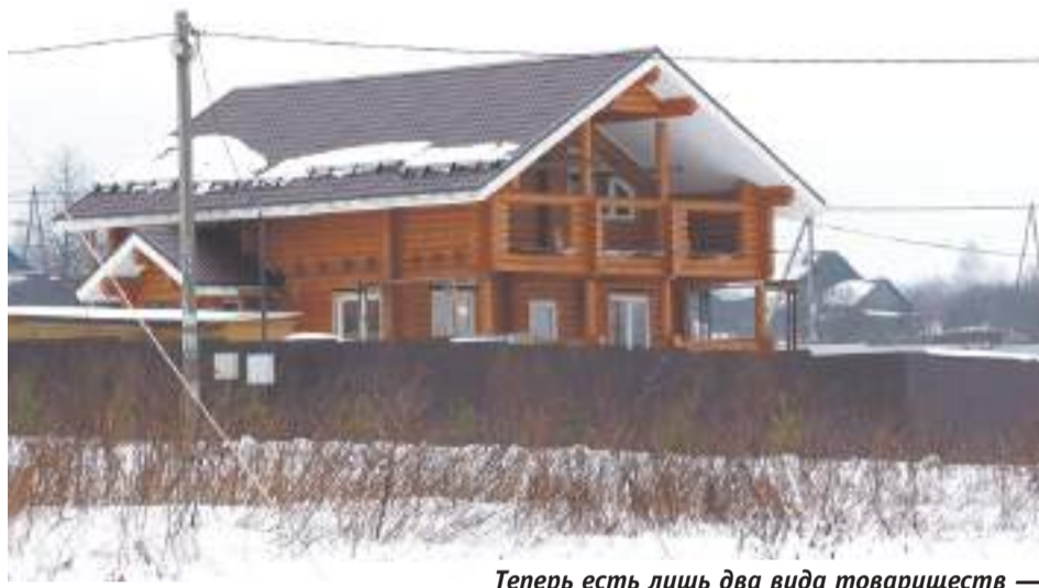
Теперь есть лишь два вида товариществ — садоводческие (СНТ) и огороднические (ОНТ)

На огородном участке, по закону, место найдётся лишь для хозяйственных культур. Есть одно «но», если участок у вас огородный, а дом на нём уже построен и зарегистрирован, то закон его защищает, а вот если нет, то нужно менять назначение