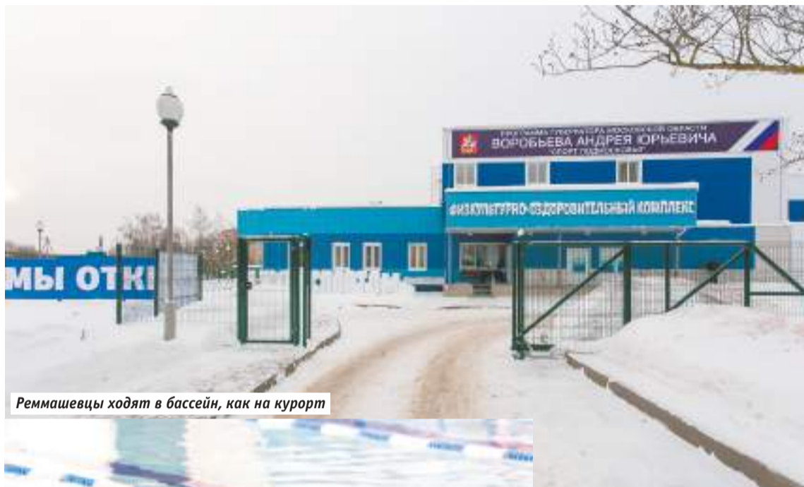
Реммашевцы ходят в бассейн, как на курорт