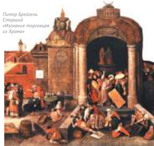
Питер Брейгель Старший «Изгнание торговцев из Храма»

Дело в том, что любое денежное пожертвование в храмовую сокровищницу можно было принести только специальными храмовыми деньгами — статыры или иначе сребреники, которые когда-то чеканили иудейские правители династии Маккавеев. Паломникам нужно было поменять свои деньги, и такую операцию выполняли менялы, которые ставили свои столы прямо у входа в храм. За свои услуги они брали комиссию, которая составляла до двух третей от суммы. На полученные статыры паломники тут же, во дворе храма, приобретали животных для принесения в жертву. Стоили они здесь в разы дороже, чем в городе, но паломники все же покупали животных именно тут, ведь храмовые служители проверяли все принесенные жертвы на отсутствие дефектов (а за проверку также приходилось платить) и чужой товар после такой экспертизы крайне редко получал положительное заключение. Чтобы избавиться от этой процедуры, люди вынуждены были покупать животных для жертв при храме втридорога. Поэтому Иисус и назвал меновщиков и продавцов скота разбойниками, обирающими богомольцев. ☩.