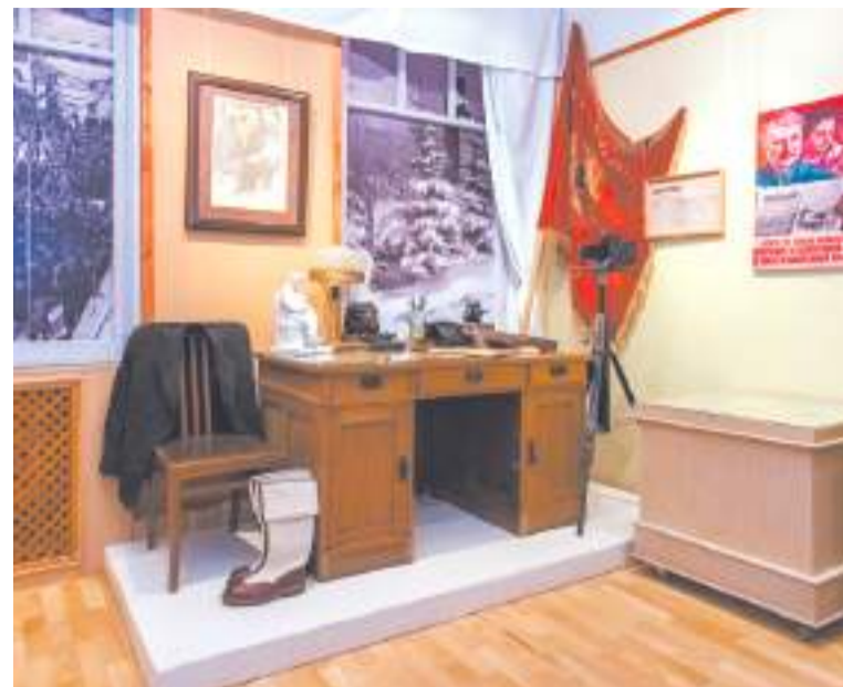
Кабинет редактора газеты 1940-х гг. (реконструкция)