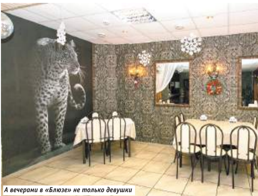
А вечерами в «Блюзе» не только девушки