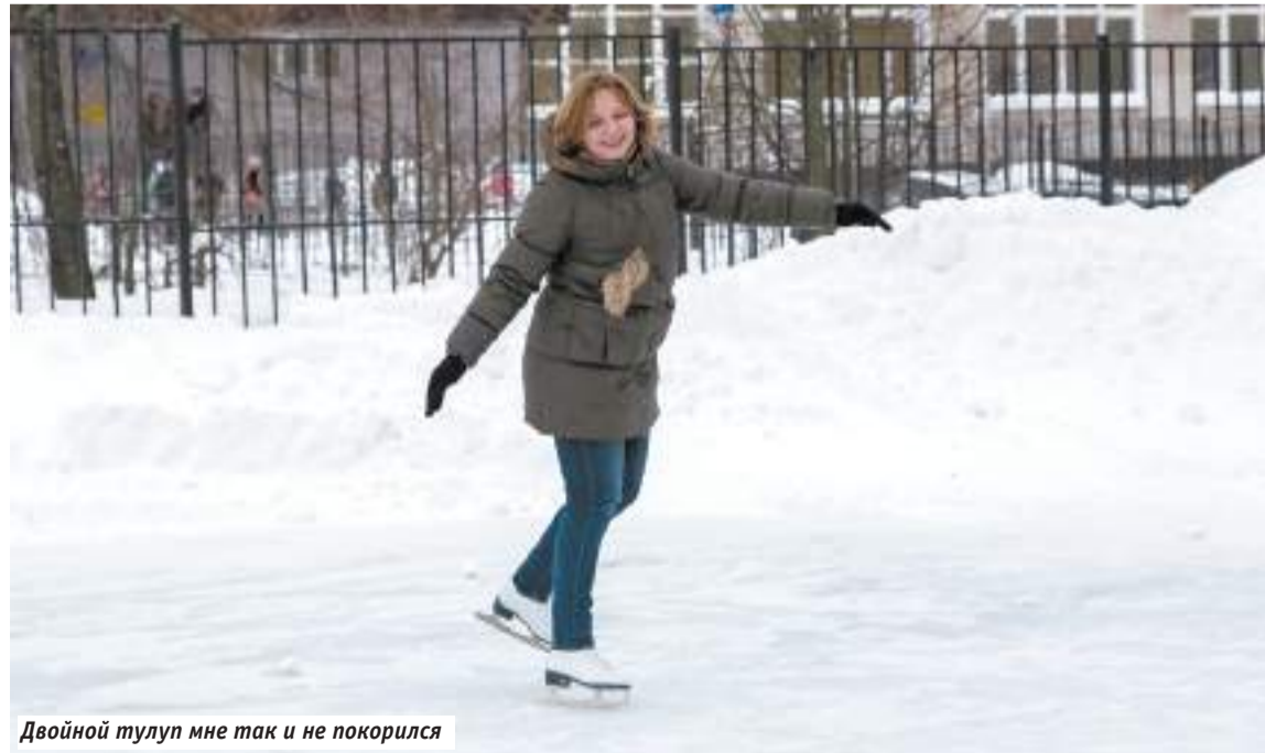
Двойной тулуп мне так и не покорился

Оказалось, что Реммаш в целом очень спортивный посёлок. Помимо плавания, тут очень любят лыжный спорт. Пробежаться по укатанному снегоходу лесным дорожкам для реммашевцев одно удовольствие. Чтобы испытать его, мне пришлось запастись