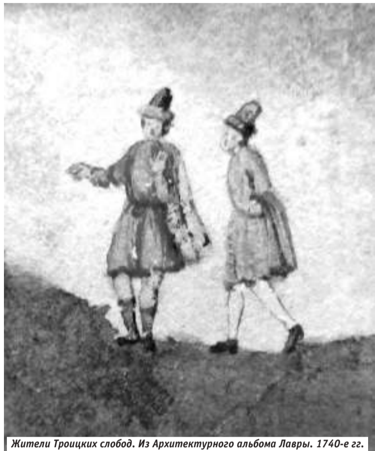
Жители Троицких слобод. Из Архитектурного альбома Лавры. 1740-е гг.