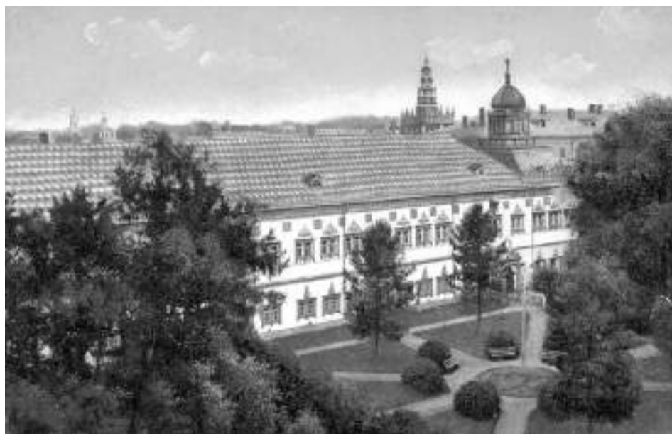
Царские чертоги — место размещения Семинарии и Арифметической школы

Учениками в школу определили два десятка служительских и подьяческих детей, которые ко времени открытия школы не обучались в Семинарии. Вопреки требованию принимать в обучение детей от 10 до 15 лет, в реестр первых двух десятков учеников школы включили девятерых «детей» возрастом