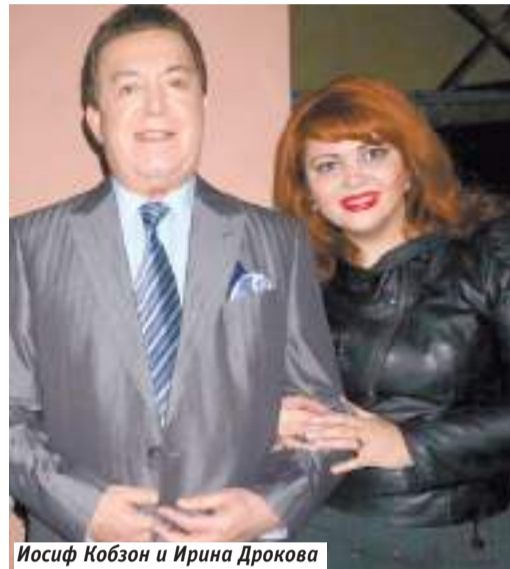
Иосиф Кобзон и Ирина Дрокова

Как представитель старой школы всегда пел живую. Однажды мы встретились с ним на вечере памяти Григория Пономаренко. Я сразу поняла, что Иосиф Давыдович плохо себя чувствует — его голос был сдавлен. Но со второй песни он начал звучать, и с залом происходило что-то необыкновенное — люди вставали. И как всегда