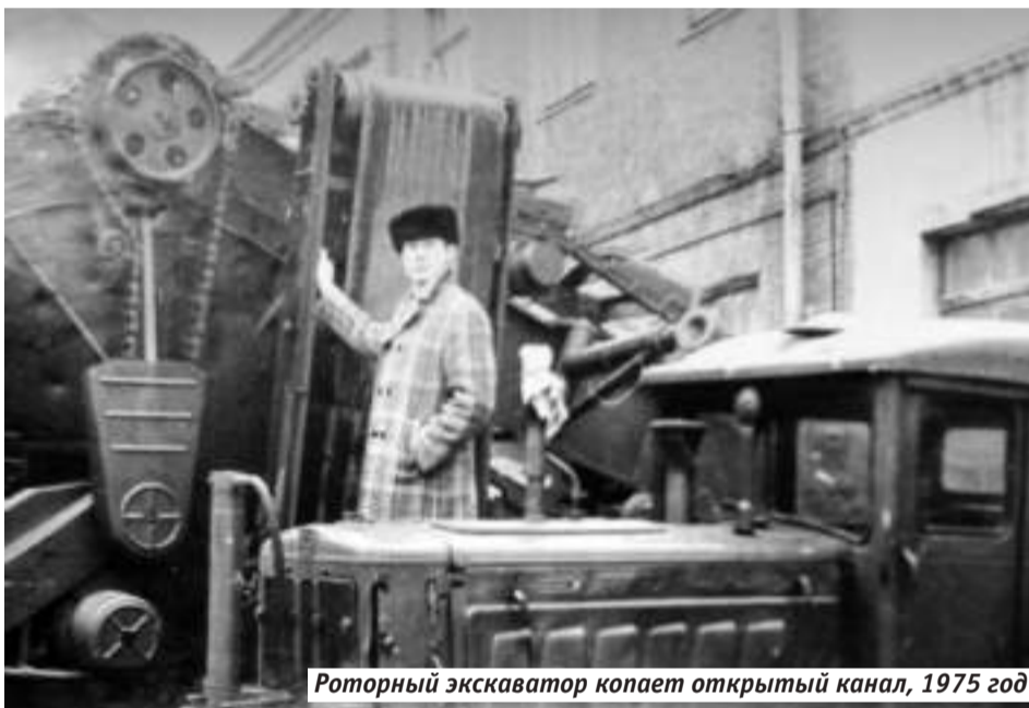
Роторный экскаватор копает открытый канал, 1975 год