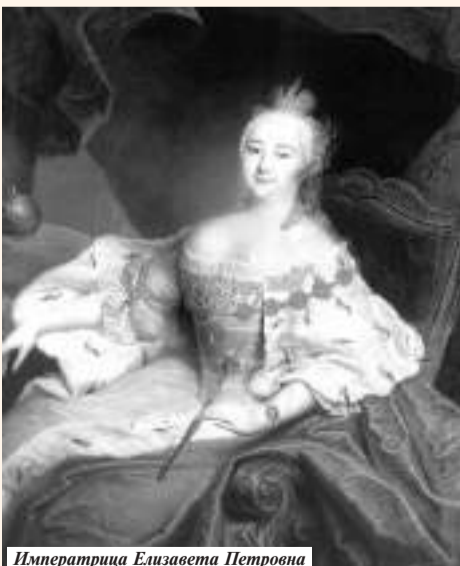
Императрица Елизавета Петровна

◆ 15 (26) мая 1763 г. (255 лет назад) в слободах вокруг Лавры царило оживле-