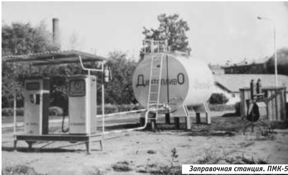
Заправочная станция. ПМК-5

Мелиорация не сводится к осушению болот или повороту рек вспять. При грамотном подходе мелиоративные техники не столько наделяют человека властью над природой, сколько помогают природе справиться с нагрузкой — в том числе создаваемой человеком. Предотвращать загрязнение сточными водами, получать урожай на засушливых землях, создавать заслон наступающим пустыням — всем этим занимаются мелиораторы.