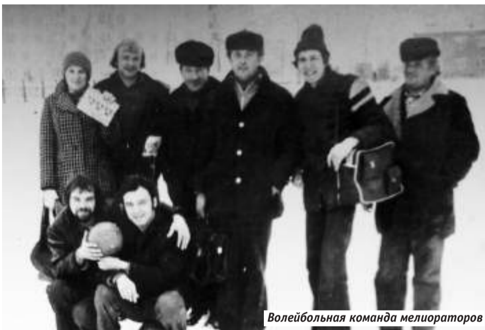
Волейбольная команда мелиораторов

— рабочие порой сами ходили на охоту в ночной лес.