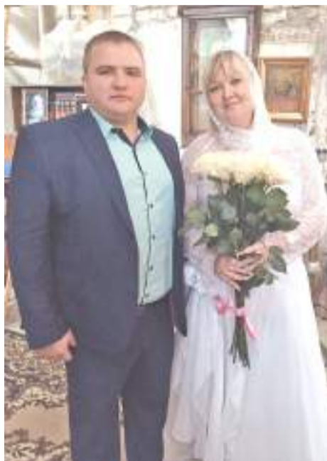
Венчание в церкви Покрова Пресвятой Богородицы в д. Заболотье