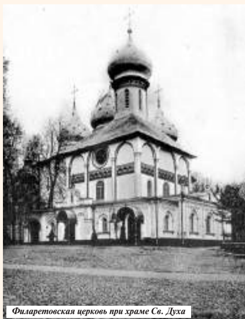
Филаретовская церковь при храме Св. Духа