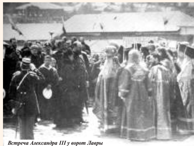
Встреча Александра III у ворот Лавры

◆ 22 (3) мая 1883 г. (135 лет назад) ровно через неделю после коронавания