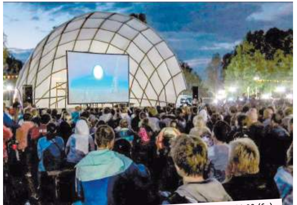
Расписание показов в парке «Покровский». Начало в 21.00 (6+)

Приведу пример: в прошлом году ко Дню космонавтики нам предложили показать фильмы прошлых лет. Молодёжь на них не пойдёт. Мы немножко выкрутились и сами заказали и оплатили фильм «Время первых». Это более привлекательно для молодой аудитории.