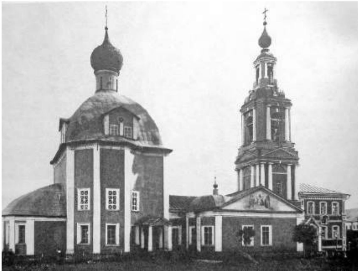
Церковь Рождества Христова

Выслушав обе стороны и справившись с законодательными актами, Собор властей Лавры согласился с крестьянами и предписал: «харчевням на прежних местах не