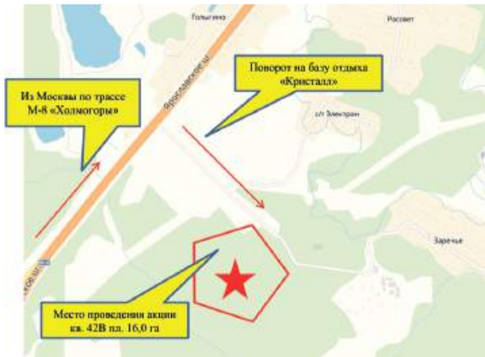
Схема проезда к месту проведения акции по посадке леса Московская область, Сергиево-Посадский район, Сергиево-Посадское лесничество Хотьковское участковое лесничество, квартал 42В площадь 16,0 га

Места проведения акции «Лес Победы» на территории городских и сельских поселений Сергиево-Посадского муниципального района Московской области (без учета мест посадки на землях лесного фонда) 12 мая 2018 года. Начало в 11.00.