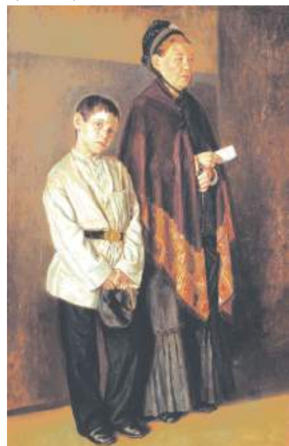
Сергей Коровин, «В приёмной» (1883 год)