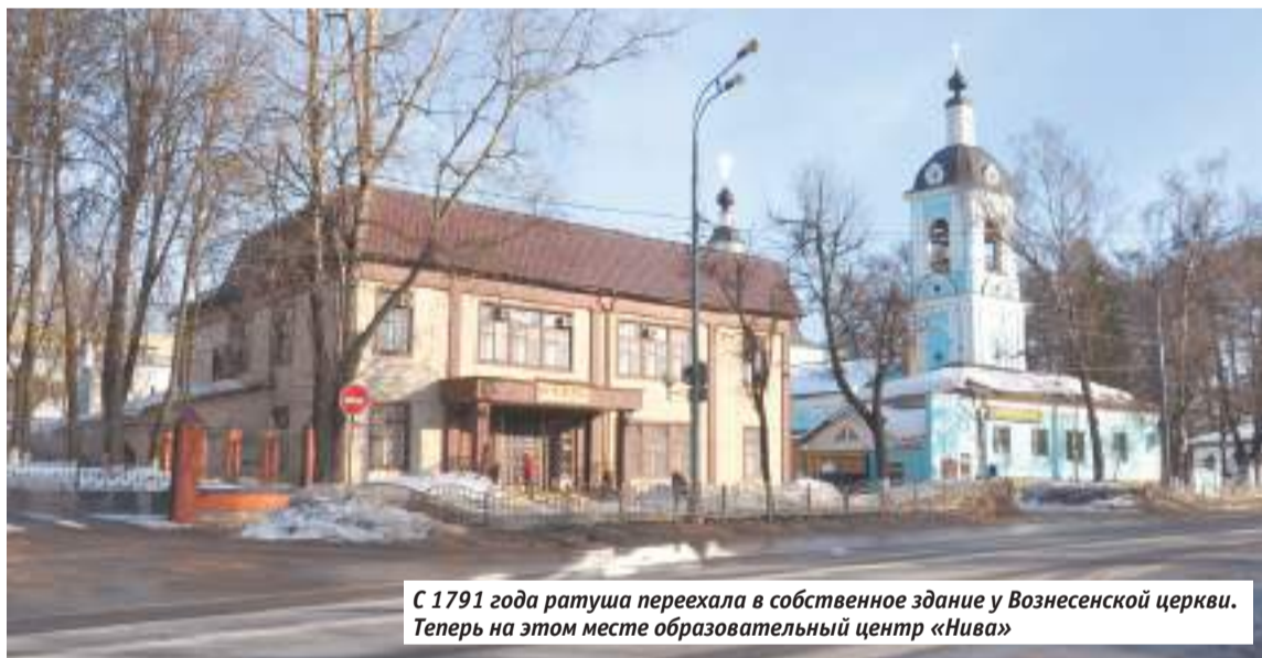
С 1791 года ратуша переехала в собственное здание у Вознесенской церкви. Теперь на этом месте образовательный центр «Нива»

менно с этим требовалось собрать деньги на содержание названных выше учреждений и квартирные деньги распорядителю судьи. Так назывался чиновник, присланный для полицейского надзора и разбора уголовных дел в Посаде и окрестных селениях. Лишь к октябрю 1782 года всё необходимое для работы присутственных учреждений было готово.