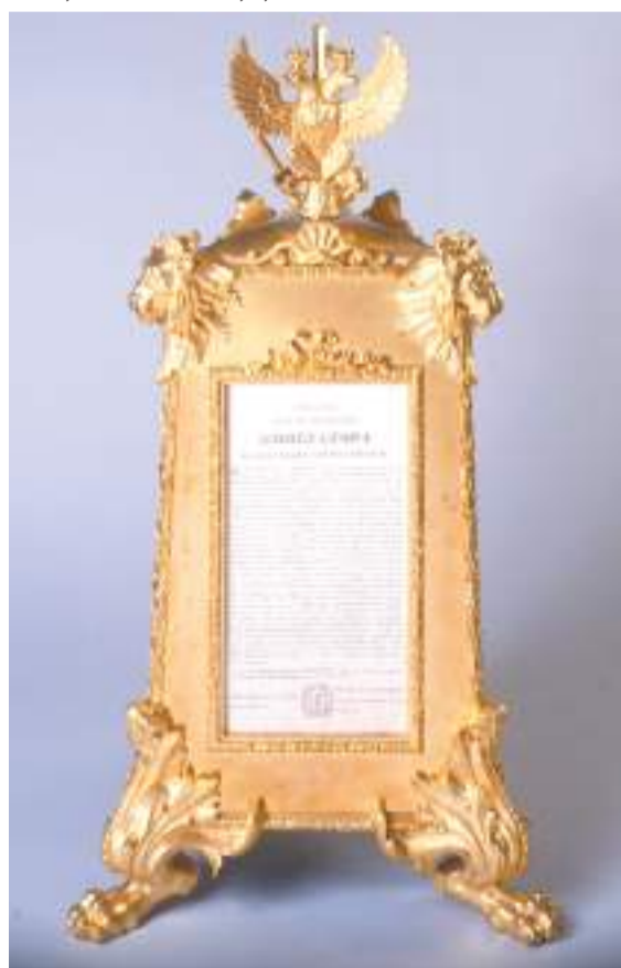
В начале заседания на стол водружался символ государственной власти — зеркало

деляла прихожую от «судейской каморы», где под портретом Екате-