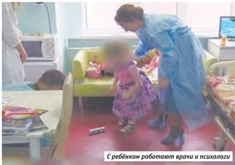
С ребёнком работают врачи и психологи