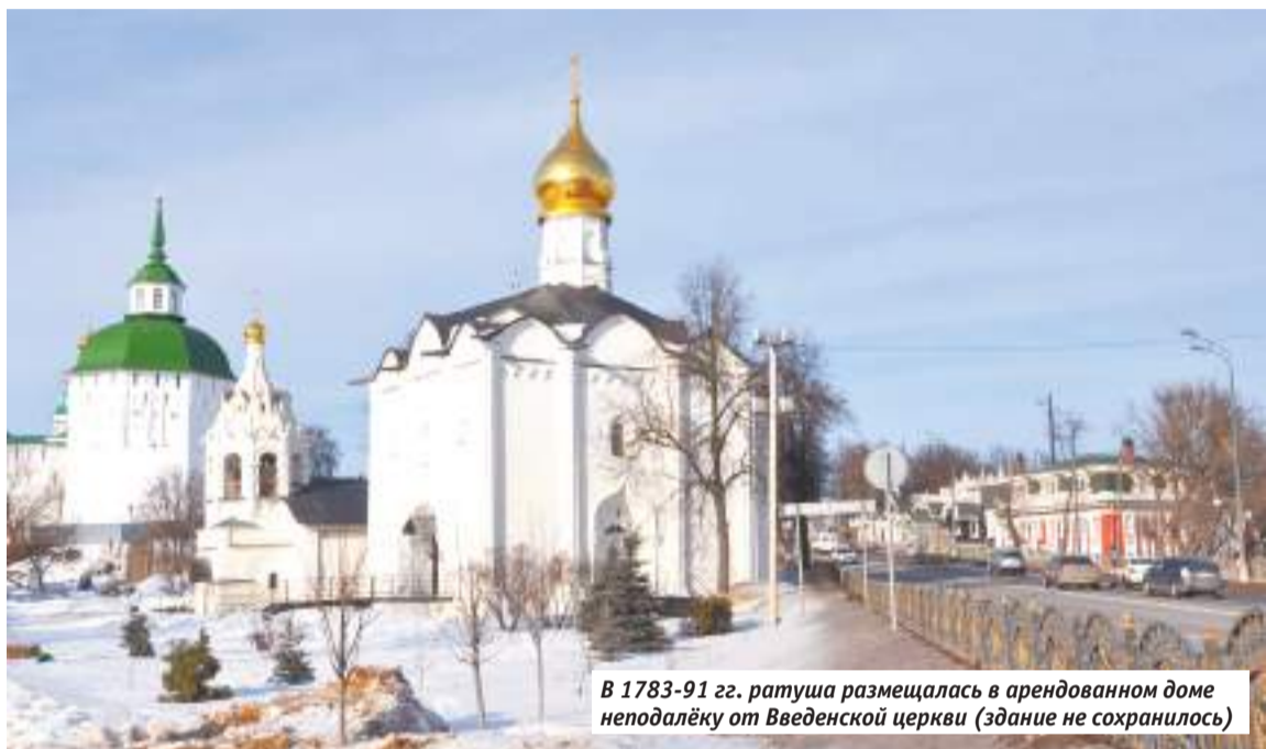
В 1783-91 гг. ратуша размещалась в арендованном доме неподалёку от Введенской церкви (здание не сохранилось)

Работу присутственных учреждений Сергиевского посада конца