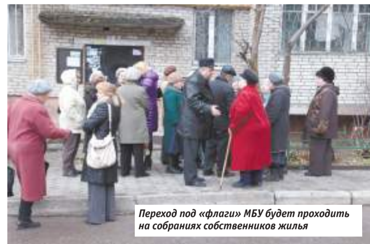
Переход под «флаги» МБУ будет проходить на собраниях собственников жилья