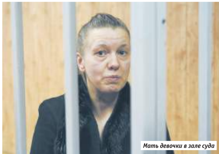
Мать девочки в зале суда