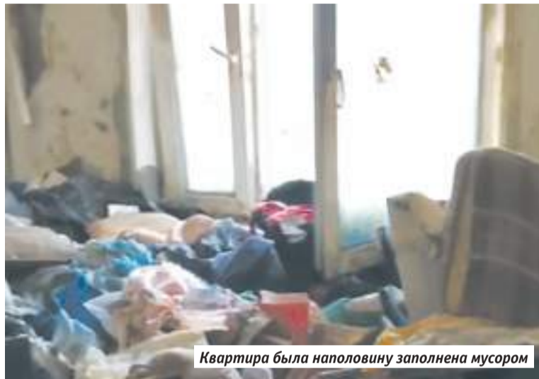
Квартира была наполовину заполнена мусором

Оксана Перевозникова