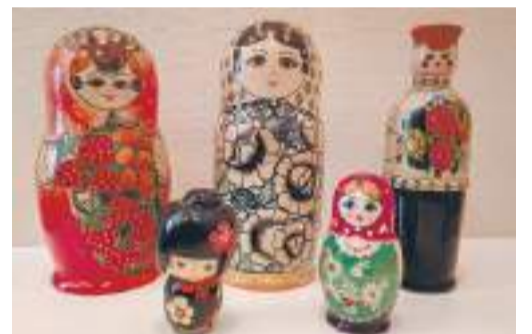
Музейные работники рассказали нам, что на некоторых ещё сохранились следы старых этикеток и ценников. Где-то на русском, в других случаях на иностранных языках.

Музей выражает благодарность за щедрый подарок.