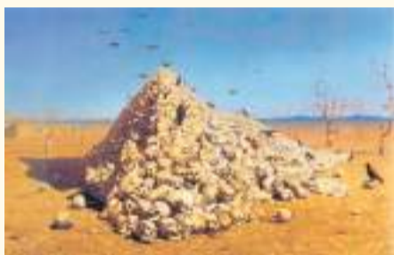
В. В. Верещагин. «Апофеоз войны»

Своё творчество художник посвятил изображению бессмысленности и жестокости войн. Картины «Апофеоз войны» часто называют самым известным полотном В. В. Верещагина.