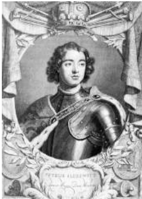
Петр I. Гравюра 1697 г.

Закрепившись на Азовском море, царь обратился к побережью Балтики. Здесь он вознамерился «прорубить окно в Европу». Устройству «окна» мешала Швеция с её сильнейшей в то время армией. Война требовала денег. В 1699 году часть необходи-