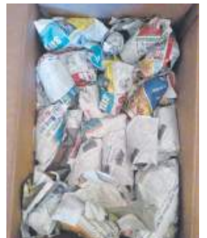
Семьдесят матрёшек были бережно обернуты в немецкие газеты

Самые ранние предметы из этой посылки датируются шестидесятыми годами XX века.