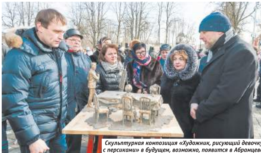
Скульптурная композиция «Художник, рисующий девочку с персиками» в будущем, возможно, появится в Абрамцево