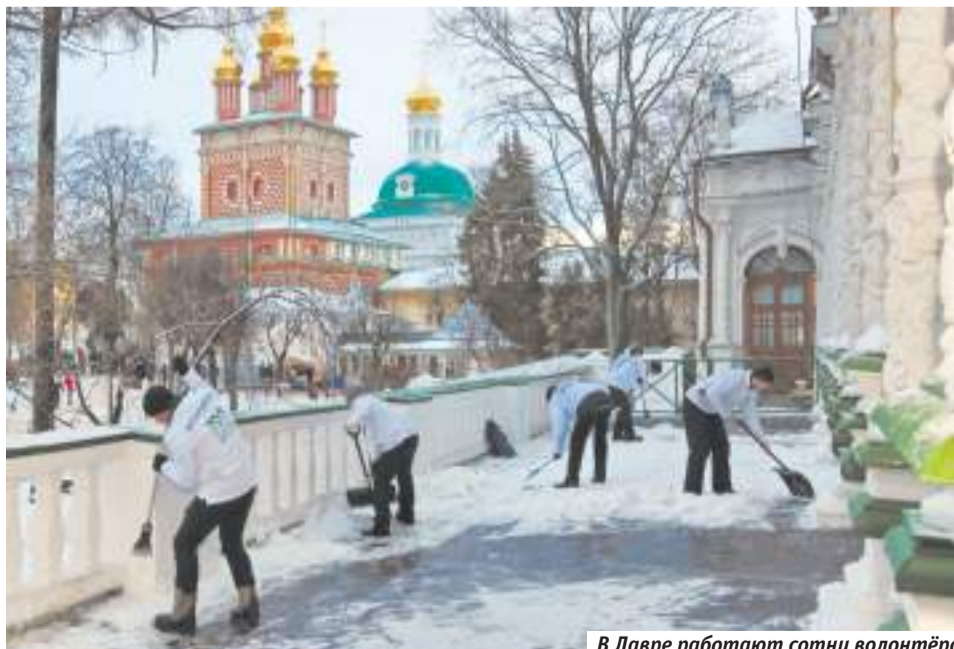
В Лавре работают сотни волонтеров из Москвы. Из Посада — почти никого

— При Лавре давно существует бесплатная столовая для малоимущих. Расскажите о ней.