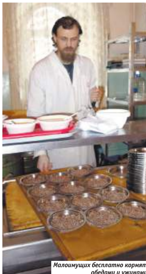
Малоимущих бесплатно кормят обедами и ужинами

Беседовал Александр Гурлин