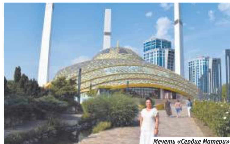
Мечеть «Сердце Матери»