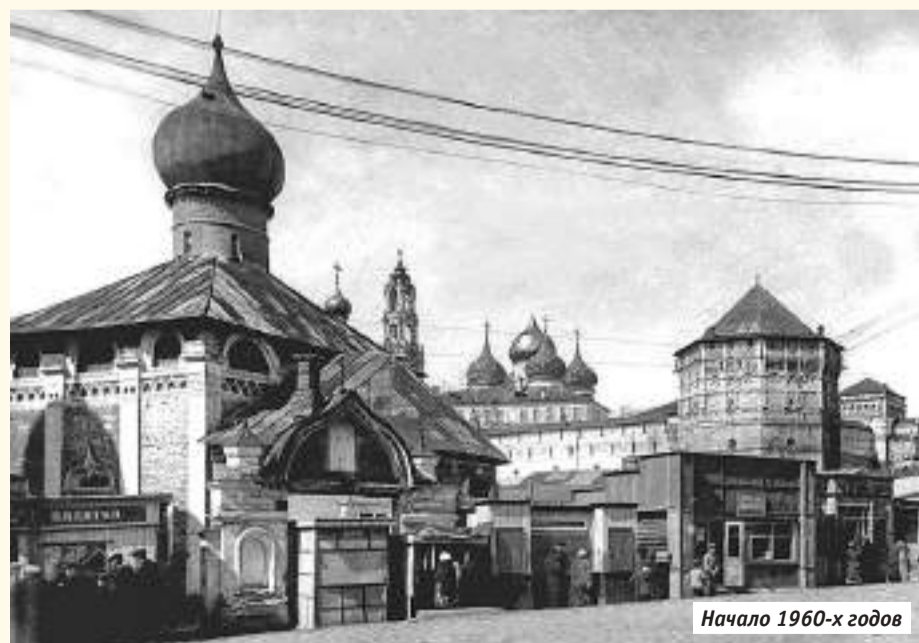
Начало 1960-х годов

В императорские времена всевозможные палаточки стояли на Красногорской площади — расхожее название у них было «шалаш». Помещение чуть побольше, где можно было зайти в торговый зал, называлось «балаган». Типовая палатка начала появляться в 1930-е годы. Сначала их окрашивали в зелёный цвет. В 1939-м перекрасили в голубой, что позволило их назвать «голубыми Дунаями». Вход в них был с тыльной стороны, а витрина запиралась на щит с замком. В 1940-50-е годы в качестве палаток использовались кузова списанных армейских машин, старые прицепы. Киоски нового поколения из стекла, пластика и металла появились в начале 1960-х годов и считались символами хрущёвской оттепели. В первую очередь делались газетные киоски, потом уже продовольственные. В 1990-е они ценились на вес золота, когда широко начала распространяться частная торговля. Их переименовали в «комки» — тогда же и случился расцвет эпохи ларьков. Потом на месте «комков» появились «Ларовские» (от названия фирмы. — Ред.) магазинчики по типовому проекту. Снизу это воспринималось как посягательство на демократические завоевания. Но позакрывались и они. Некоторые палатки «Союзпечати» ждала интересная судьба — возле дома № 180 по проспекту Красной Армии она превратилась в первую в городе антикварную лавочку. Похожая была у шестого завода. Но потом ушло и их время.