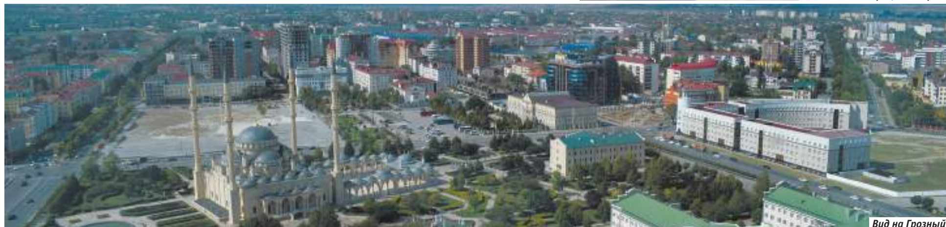
Вид на Грозный