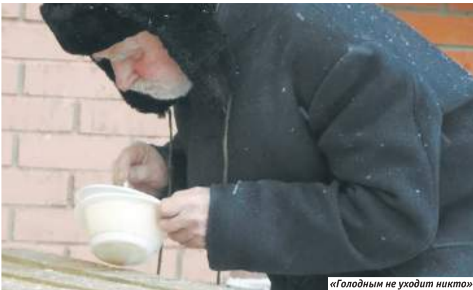
«Голодным не уходит никто»