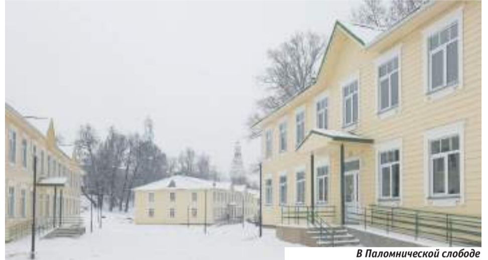
В Паломнической слободе предоставляются бесплатные номера