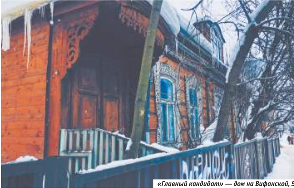
«Главный кандидат» — дом на Вифанской, 5

— Нет, в нашем случае это не история, когда собрались на выходные и покрасили что-то. Фестиваль длится несколько месяцев, иногда всё лето. За это время, конечно, обновляется краска, но проводится много других работ, вплоть до капитальных. Мы сейчас ищем реставратора, чтобы показать ему несколько домов, а он уже профессиональным взглядом прикинул бы, что можно сделать и сколько это будет стоить. Параллельно реконструкции силами волонтеров делается много другого. Фестиваль привлекает совершенно разных творческих лично-