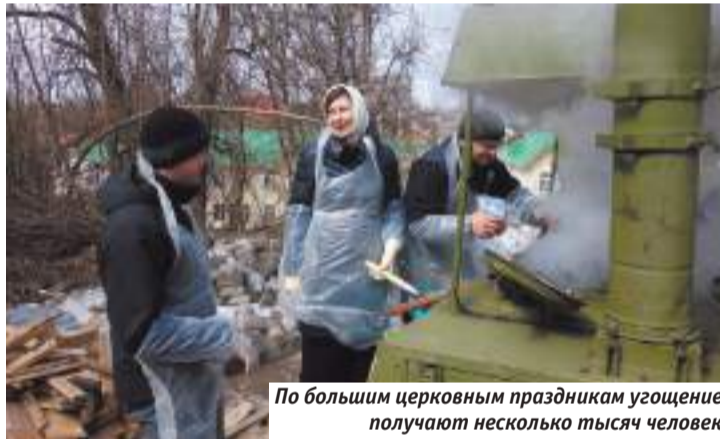
По большим церковным праздникам угощение получают несколько тысяч человек