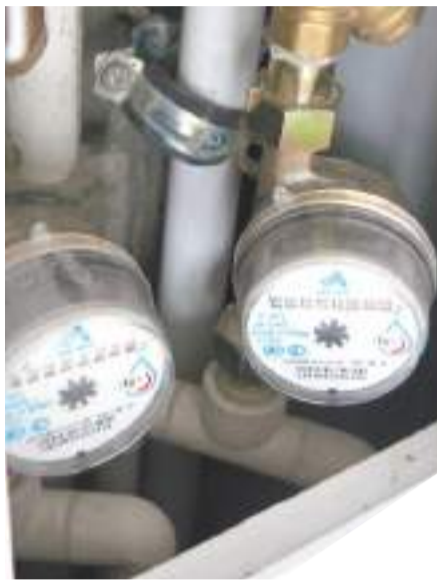
вании общедомовых систем.

Авторам закона, естественно, задают главный вопрос: как нововведение отразится на кармане потребителей услуг? Эксперты считают, что в данном случае от перемены мест слагаемых в коммунальной платёжке сумма может уменьшиться. Ведь включается механизм взаимной заинтересованности в более качественном и экономичном обслужи-