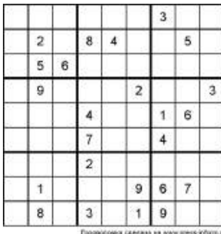
Подготовка сделана на www.press-inform.ru

Необходимо расставить в клетках числа от 1 до 9 так, чтобы в каждой строке и столбце большого квадрата, а также внутри каждого из малых квадратов числа не повторялись.