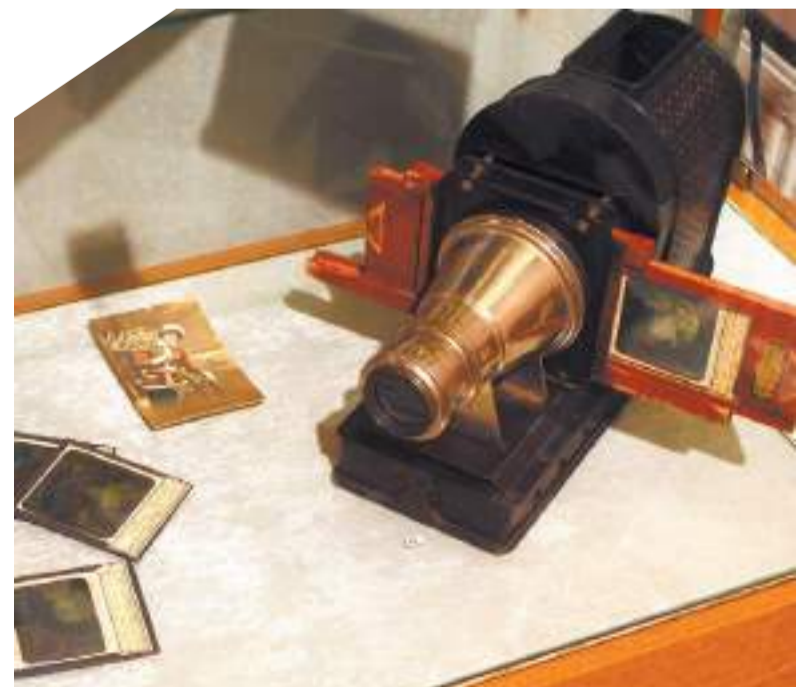
Видеопроектор «Волшебный фонарь» и слайдовые картинки